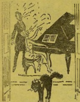
HIA CHENT MOLT CRUEL EN ELS ANIMALS

En una fonda, sentats a una mateixa taula, sopen un valensià i un anglès.