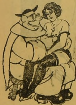
—Pare, ¿aixó qué es? —El butall de la campana, filla.