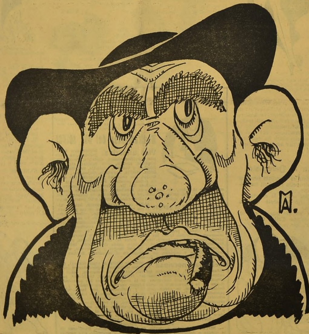
Retrato auténtic del padre Gerulo

Suscripció en Valencia, no s'admitix — — Fora: 3 pesetas, trimestre; 5, semestre; 10, añ