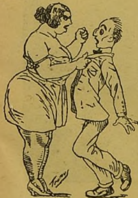
—¡Te vaig a pegar dos puñacs, animal! —Y yo a tí tres. —Si m'as pegues tres, confarone.

LLIT DE FERRO , tot plenat de chinchies, tan amaestraes, que piquen, fuchen y no hia cristo que les mate. Carrer de la Picor, 46.