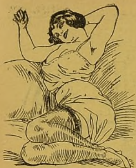
UNA BOXEADORA. —Si algú de vostés vol luchar, que vacia despullantse.