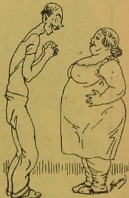
—¡Ay, qué bel! (En les ganas que tenía yo d' atracarme de pangaceos!)

Cocletas al plato. —Se toma como un kilo de caspa de pixcaor de caña, tres id. de serradura de suro, cuatro litros de sabón muello y dos armudes de retallatres de potas de burro chitano. Se mescla todo y se fica en un cusio de los de colar la bugada, en donde se fican asimismo trese litros de flexin; se remeneya todo bien remeneyado, y coando esté ya a punto caramelo, s' hasen las cocletas, que se sirven en casabitos chicotitos, a l' estilo de los formachetes. Si los que los proeban se moeren, ya podeis ancomanaros a Dios, pos es seguro de que, a pesar de l' abolición de la pena de moerte, vos penchan si sois mascles. ¡Vaya que vos penchan!