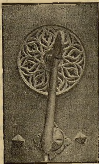
Aldabon de la casa residencia de los seises de la Catedral del Pilar.

ella se recuerda; semana de indulgencia , porque en el jueves eran reconciliados los penitentes, y semana auténtica , porque en ella se encuentra el origen y fundamento de la divina redención.—También en la iglesia de Oriente han dado á estos días distintos nombres, que demuestran en su corta extensión la triste solemnidad de este periodo. Llamanlos días de Dolores ,