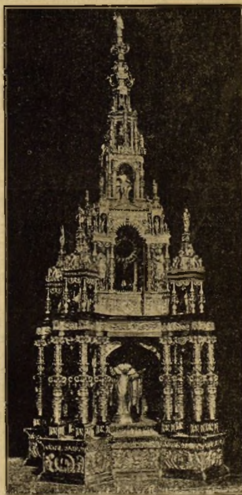
Custodia procesional de la Catedral de La Seo.

res, propalados en todo tiempo desde que Calvino avanzó más en la heregia luterana; de ahí ese escepticismo de que, con sentimiento de todo buen católico, hacen