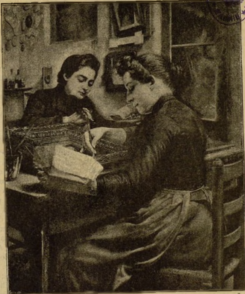
DORADORAS. Cuadro de D. Manuel Cusi

En el párrafo 2. o , en que trato de la custodia toledana, léase diseño donde dice ducho y olinto donde aparece plícato .