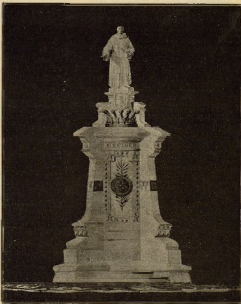
MONUMENTO A D. FRANCÉS DE ARANDA

«Finalmente, la estatua del Venerable, llevando en la mano izquierda su bolsa inagotable y siempre abierta para remediar una desgracia y el pergamino conteniendo la institución de la Santa Llamona para pobres de la ciudad de Teruel, y su derecha en actitud de socorrer á un desgraciado.»