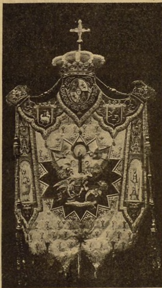
MILAGRO DE CALANDA