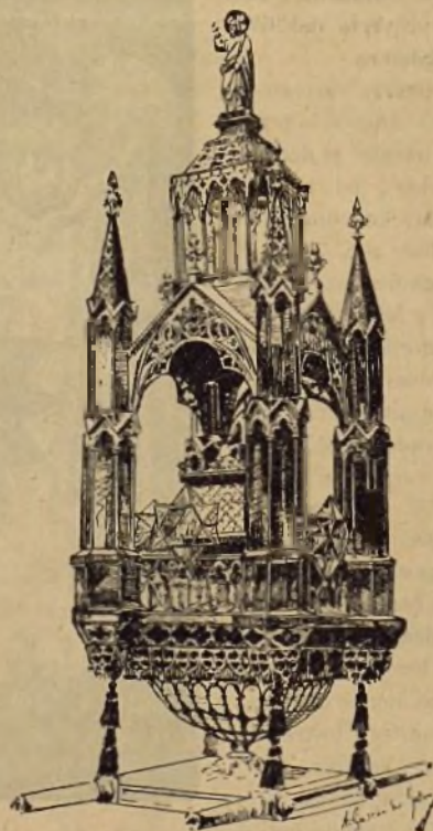
ARCA DE LA ALIANZA (Farol del Rosario del Pilar).

Un precioso grupo se destacaba en esta parte de la carrera: el estandarte de San Jorge, de raso blanco y rojo, llevado por la Real Maestranza de Caballería con sus vistosos trajes, y cuatro grandes faroles