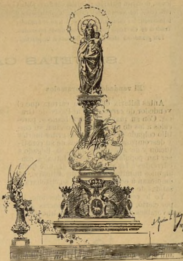
PROYECTO DE FAROL DE D. VALERO TIESTOS

Descansan sobre las andas cuatro columnitas que sostienen igual número de palomas en actitud de volar de cuyos picos sale una preciosa guirnalda de flores. Sobre el friso se halla un mundo en cuyo centro y parte anterior están el anagrama y escudos de la Virgen y el del Cabildo, y á ambos lados los de la Diputación y Ayuntamiento; en su parte posterior irá el de la persona ó corporación que lo costee. Unas cubecitas de ángeles aparecen en los cuatro extremos de un pedestal y más arriba del mundo, sobre el que se eleva artísticamente una nube, gallardo y arrogante, rodeado de palmas y querubes, véase el glorioso Pilar de María con su imagen, cuya corona de estrellas formada por doce focos eléctricos, irradiaría potentes rayos de luz.