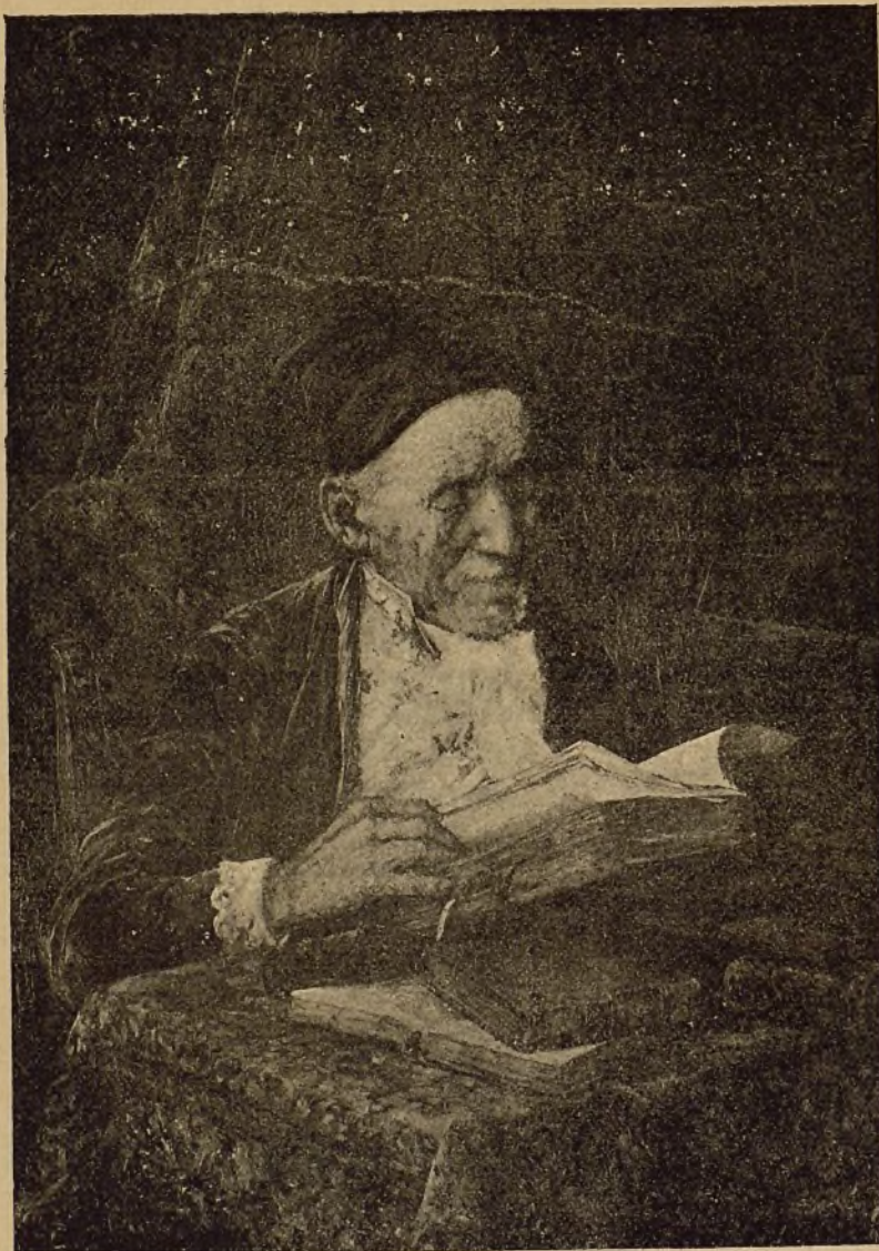
LOS MEJORES AMIGOS

Te contemplo desde aquí pi- diendo por nosotros misericor- dia en el Misereatur vestri ; implorando nuestro perdon en el Kyrie ; lleno de gozo en el Gloria in excelsis Deo ; ofre- ciéndote á Dios, como Jesucristo se ofreciera al eterno Padre; en- tregado á la Oracion, de igual manera que Jesús en el Huerto de las Olivas... y en el Hanc igitur , en esos preciosos mo-