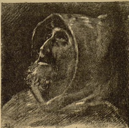
EXTASIS RELIGIOSO—SAN FRANCISCO DE ASIS Dibujo de D. Ricardo Villodas.