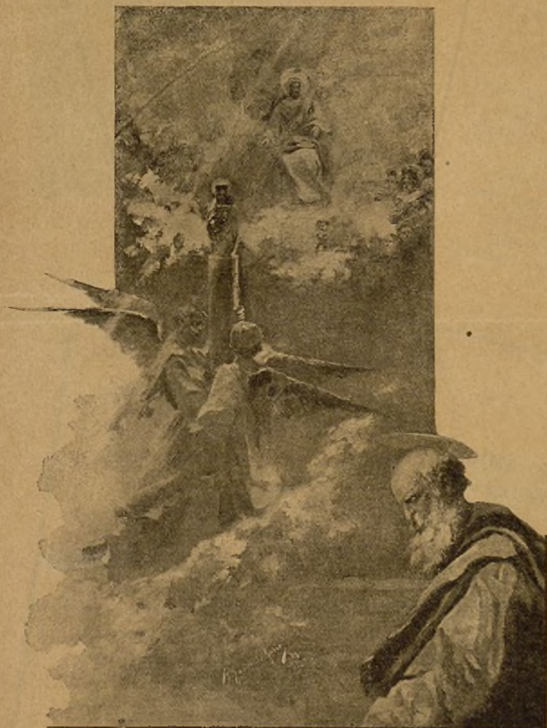
VENIDA DE LA VIRGEN DEL PILAR (Pintura á blanco y negro, original de D. A. Gascón de Gotor)

Número suelto, . . . . . 26 cénts. Anuncios á precios convencionales Pagos adelantados