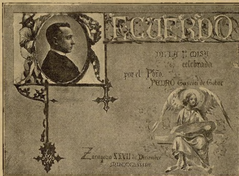
Pintura á blanco y negro original de D. A. Gascón de Gotor.