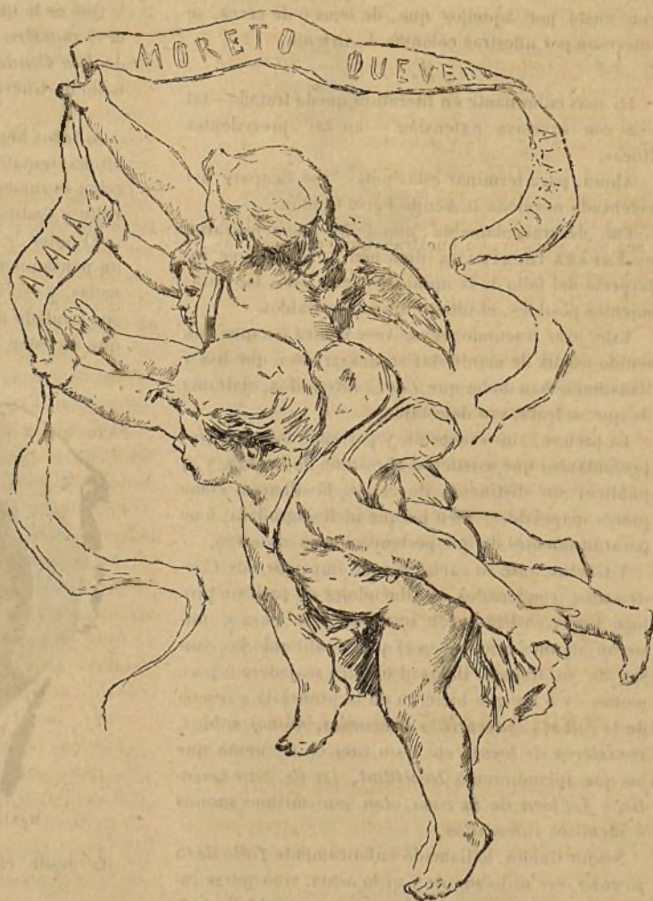
TEATRO ESPAÑOL.—DETALLE DE LA EMBOCADURA DEL ESCENARIO (Pintura al óleo por Pelayo)

Arido y pesado va á resultar el que me ocupe, después de tantas cuartillas, del movimiento científico habido en Enero.