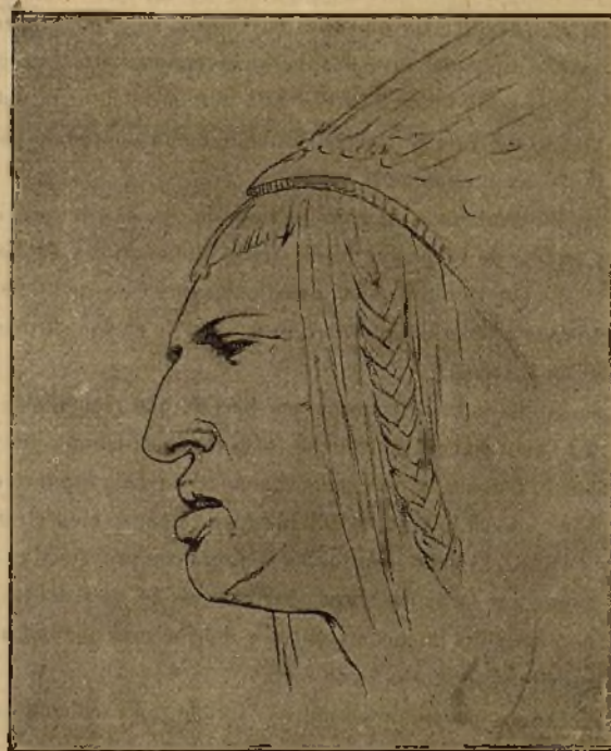
AMERICANO DEL NORTE

Dibujo de D. José Garuelo publicado en la notable obra del Sr. Parada y Santín, Anatomía pictórica .