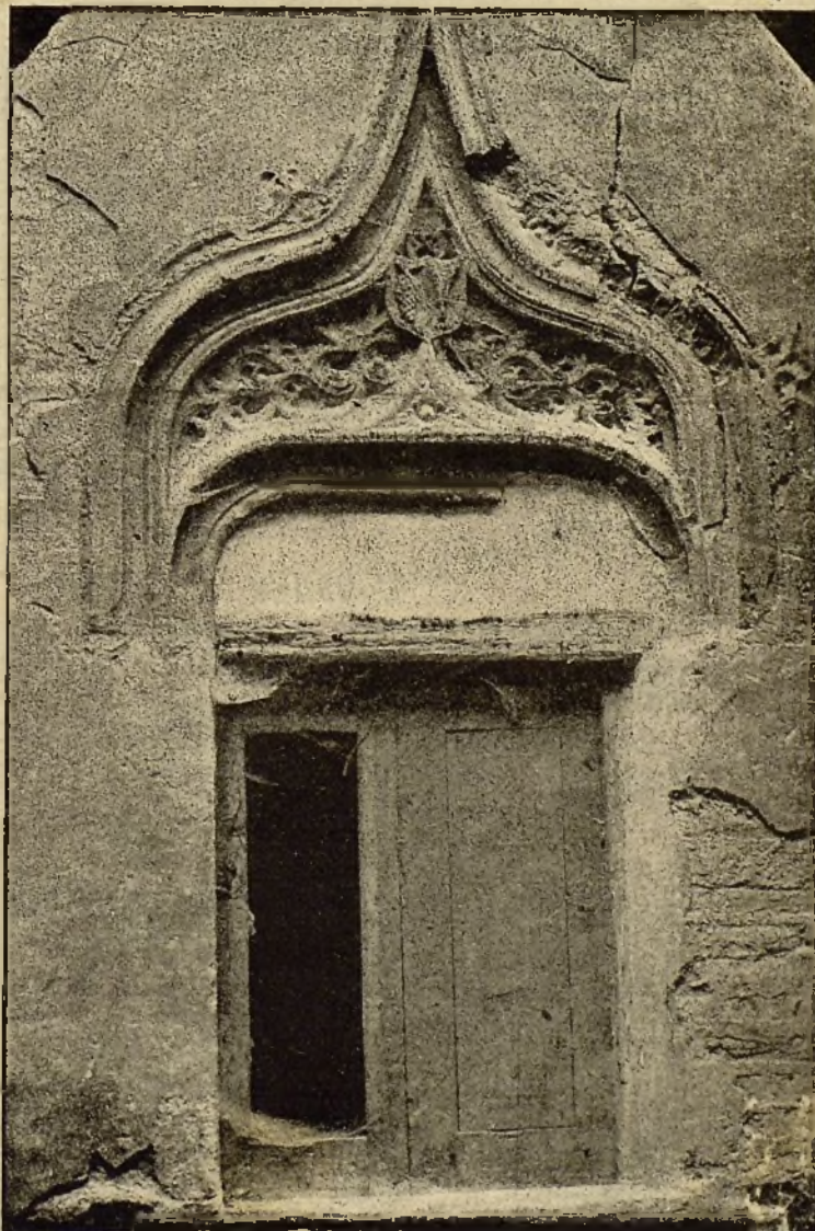
VENTANA OJIVAL DEL COLEGIO DE LOS RR. PP. ESCOLAPIOS DE ZARAGOZA

Dirección y Administración del periódico, Pilar, 19, Zaragoza.