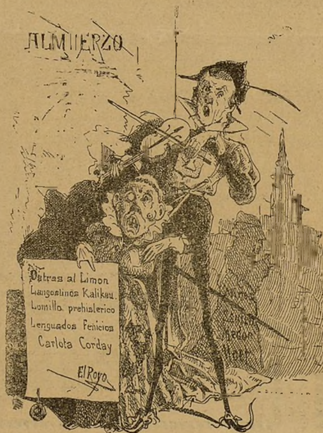
CAPRICHIO (dibujo de D. Agustín Peiro). Escritor y dibujante fallecidos.

En el texto: Lechuguino , dibujo de Gascón de Gotor.— En acecho , fotograbado.