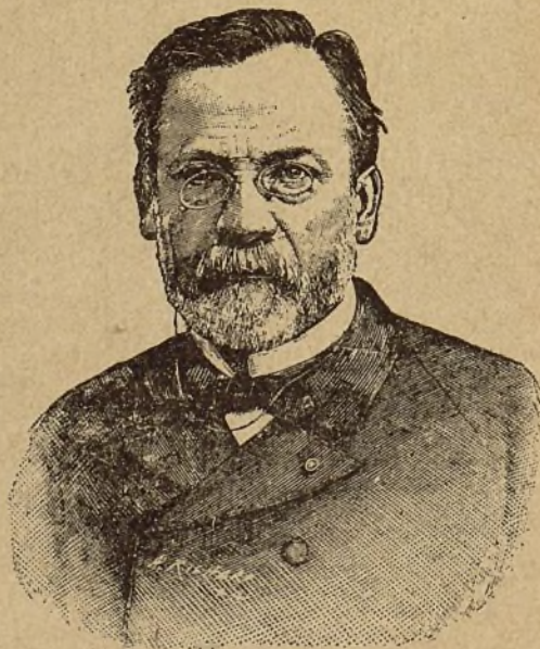
Mr. Louis Pasteur

Nació en Dole (Francia) el 27 Diciembre 1822. † en Garches (Francia) el 28 Septiembre de 1895.