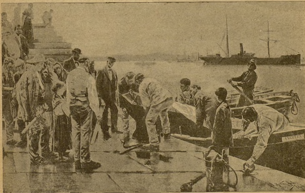
El entierro del piloto

des de los siglos. En sus inmediaciones se desliza el caudaloso Tíetar, en su estrecho cauce, y tras las colinas vecinas, que se retratan en los claros cristales del río, se oculta á las miradas el lugarejo de Quacos, en el agreste y desigual suelo extremeño, guardando entre los