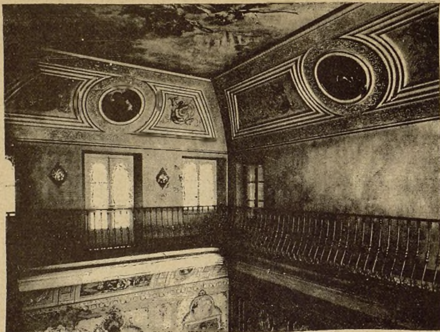
EXPOSICIÓN DE CÁDIZ.—ARTESONADO

nes de Pedro de Alarcón y Echegaray; siguen Carlos Pathy ; Albino Horösi que ha adquirido gran renombre, con sus estudios de famosos poetas españoles como Zorrilla, Campoamor, Núñez de Arce, etc. y muy especialmente con sus traducciones notabilísimas de las poesías, perlas de la literatura moderna.