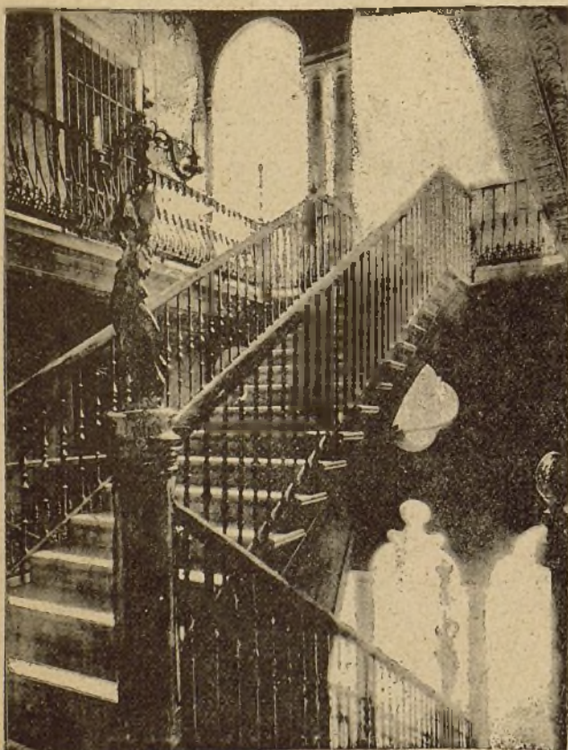
EXPOSICIÓN DE CÁDIZ.—ESCALERA DE MARFIL