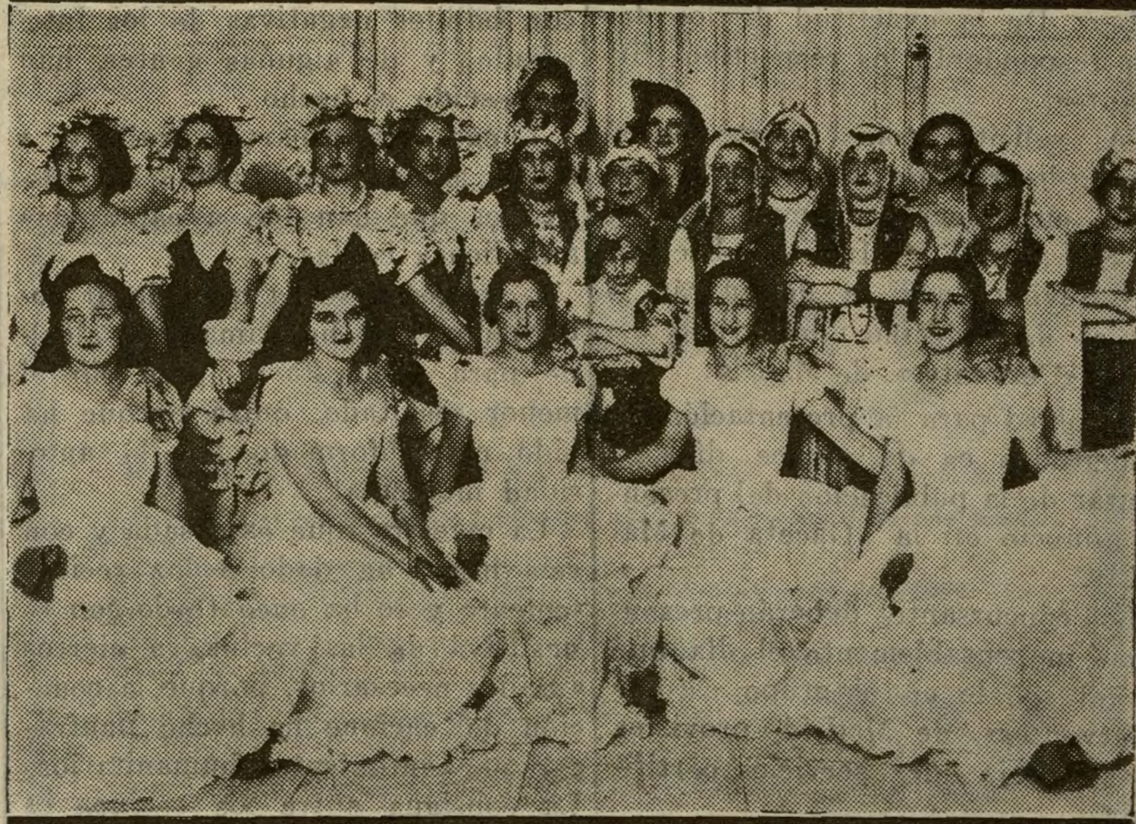
Señoritas que han tomado parte en el festival a beneficio de las escuelas católicas del Puente de Vallecas y de Tetuán.