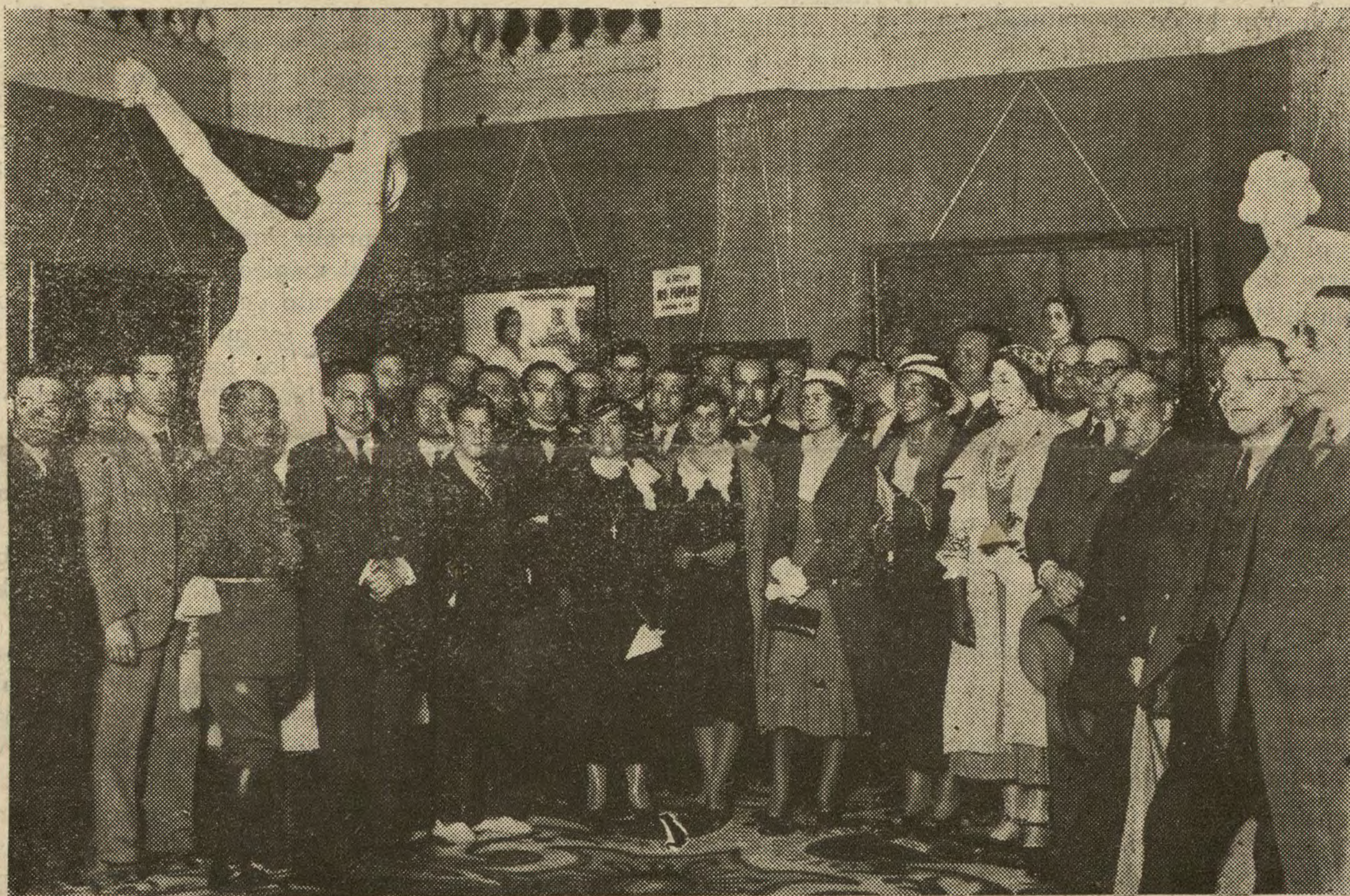
Un momento del acto inaugural celebrado ayer tarde, con extraordinaria y distinguida concurrencia. (Foto Yubero).

Ayer quedó abierta nuestra «Exposición Libre de Bellas Artes», que durante toda la tarde fué muy visitada por numeroso público, formado en su mayoría por artistas y críticos.