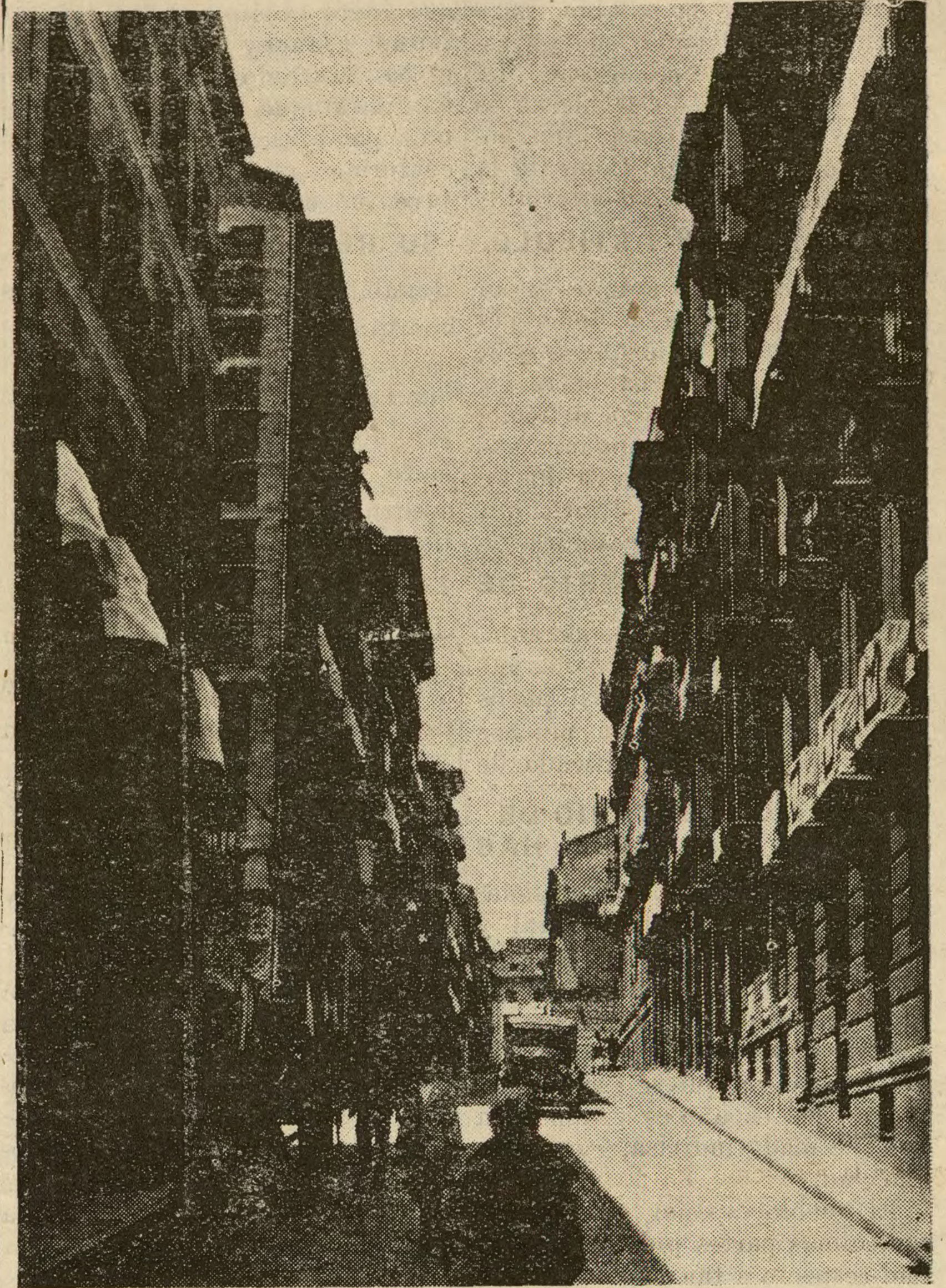
Una calle de los barrios bajos de Madrid, donde, naturalmente, ha sido menor el número de colgaduras.

España, en efecto, es un Estado laico; pero los españoles—a lo me-