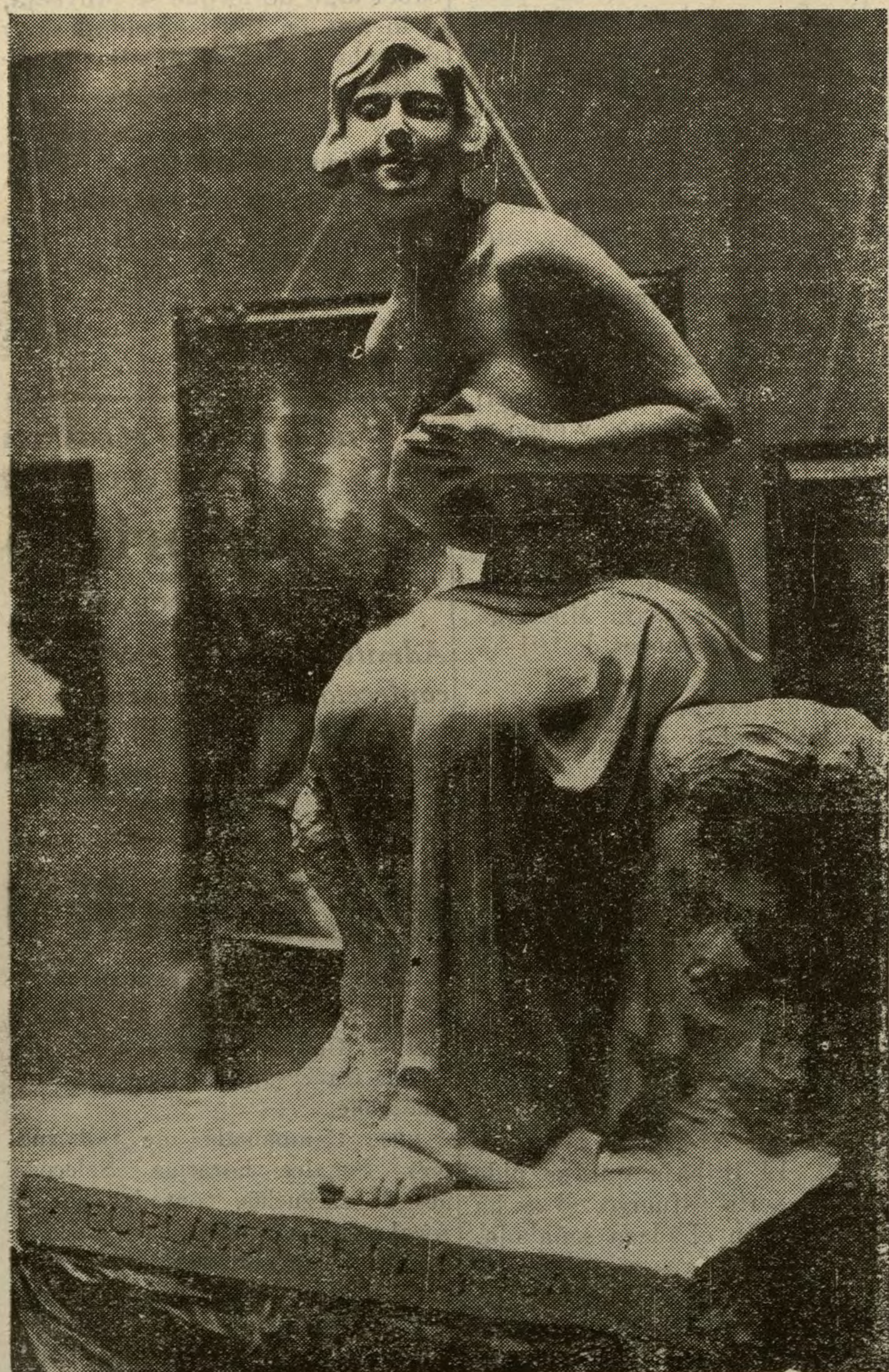
CATALOGO ILUSTRADO DE NUESTRO SALON «El placer de la brisa», estatua, por Francisco Sánchez López.

LA EXPOSICION LIBRE DE BELLAS ARTES en el «DIARIO UNIVERSAL»