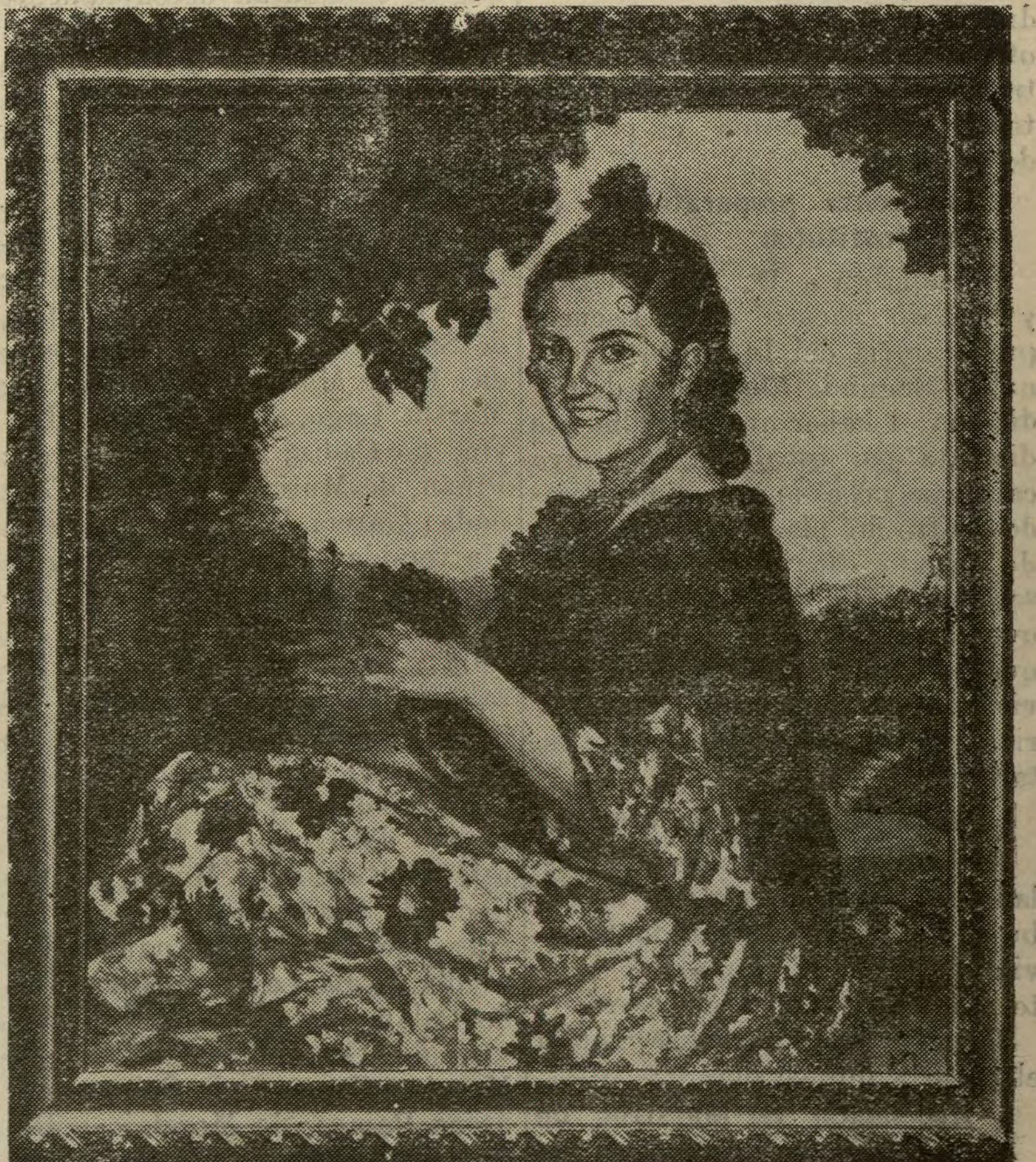
Retrato de señorita, por María del Milagro Dara y Pérez de Madrazo.

NO SE DEVUELVEN LOS ORIGINALES QUE SE NOS REMITAN