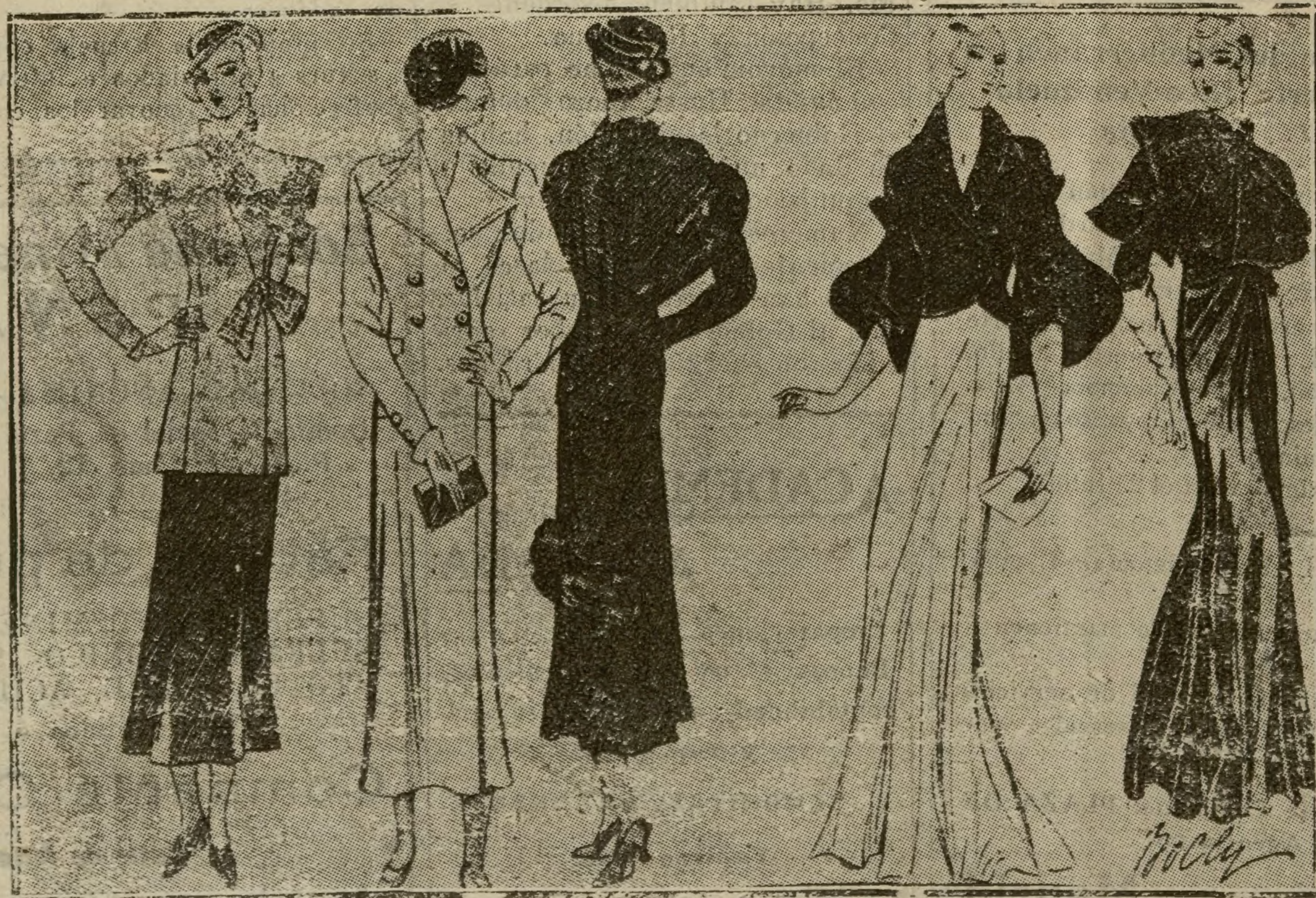
Últimos modelos de París.