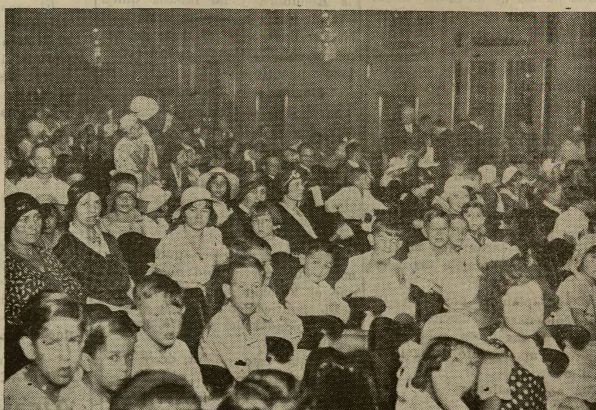
Un grupo de alumnos premiados del Liceo