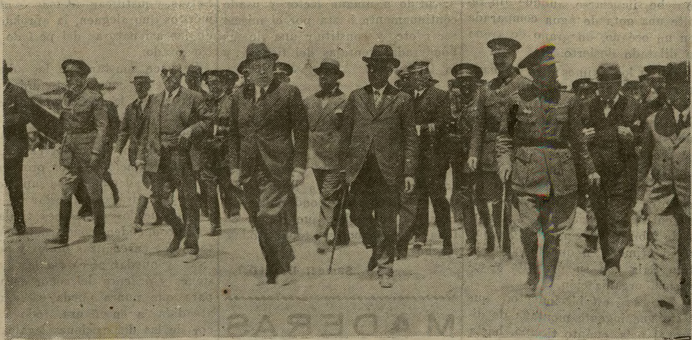
Final de las maniobras de Carabanchel. El Presidente y demás altas personalidades pasaron revista al campamento donde acampan los cadetes, cuyo momento es el que se reproduce.

DOSIS: 1 ó 2 granos al cenar. SE EXPENDEN en FRASCOS de 25 y 50 granos.