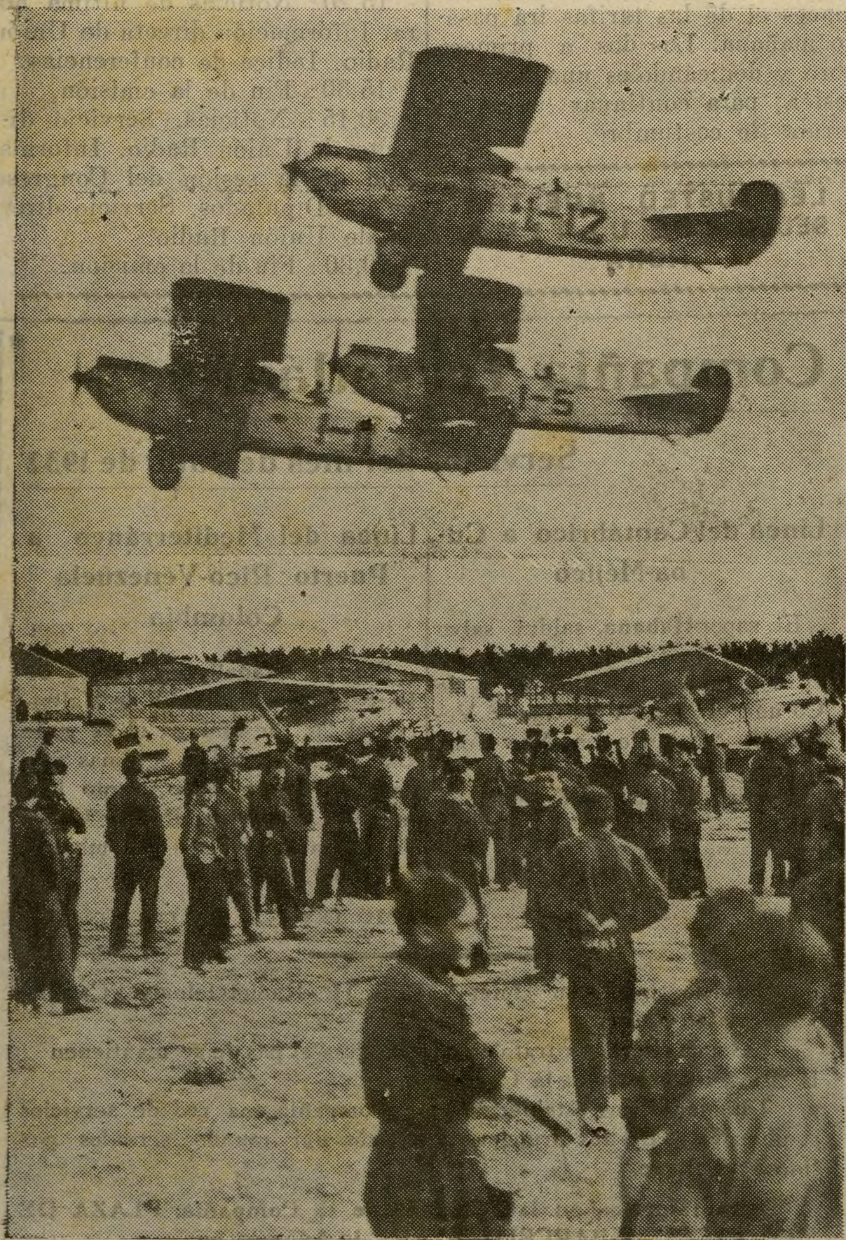
Salida de la escuadrilla militar para la vuelta a España.