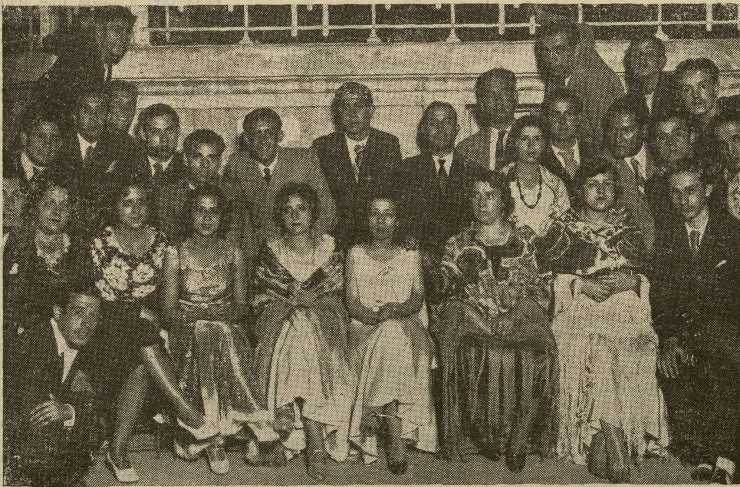
La Casa de Toledo ha celebrado, en el Retiro, una grandiosa verbena, en la que hubo originales concursos. En la foto aparecen algunas de las señoritas premiadas.

CIUDAD DEL VATICANO julio 5 (D. U.).—El Sumo Pontífice ha recibido en audiencia privada al cardenal Vidal y Barraquer, arzobispo de Tarragona, y al cardenal Illundain,