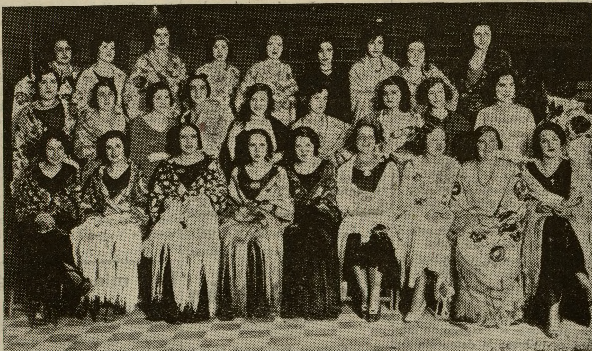
Señoritas aspirantes al premio de mantones, en el concurso celebrado anoche en la citada verbena.