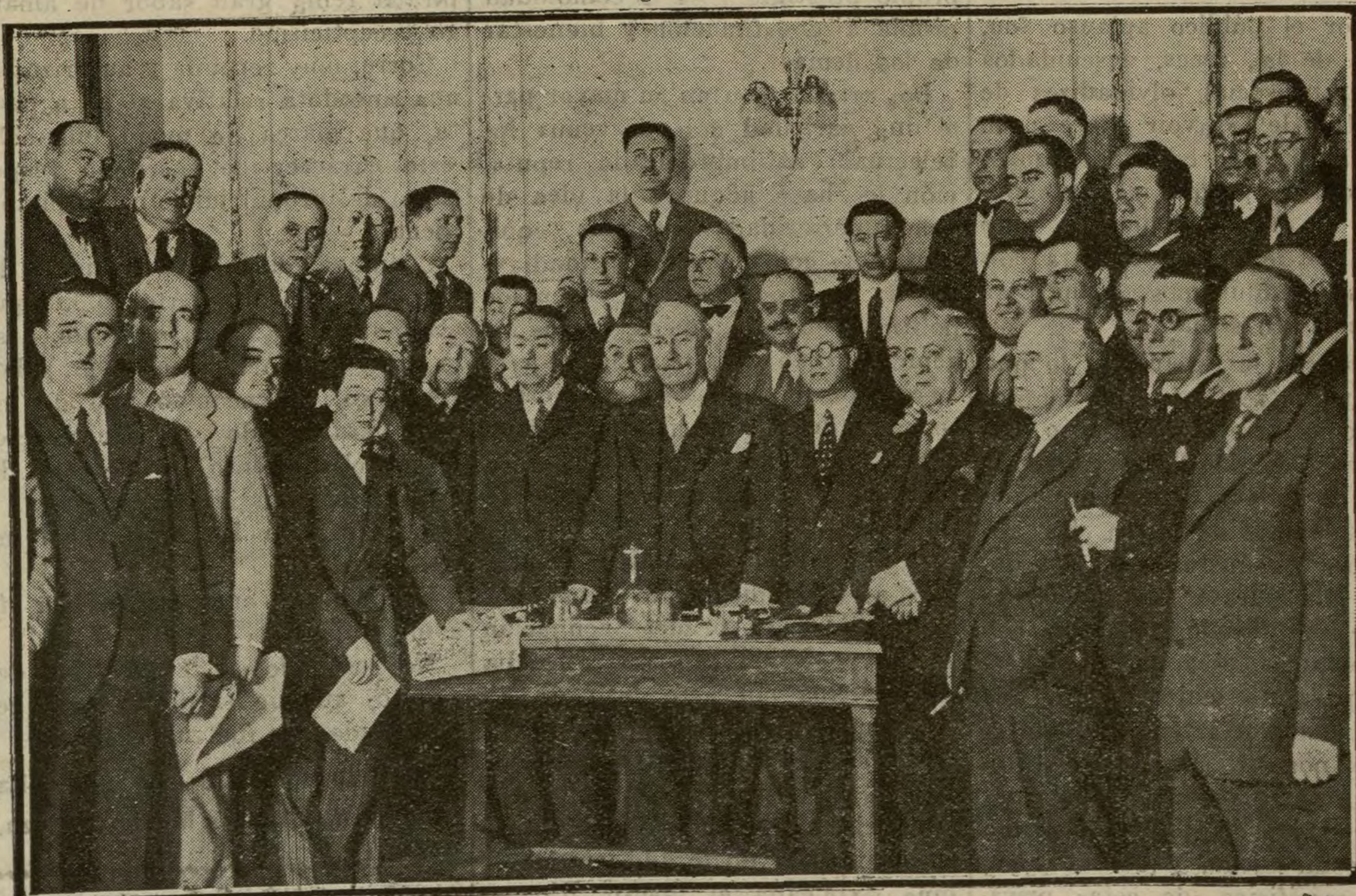
La minoría radical en la trascendental reunión celebrada esta mañana, en su domicilio central

Esta mañana regresó de La Granja el presidente de la República, viniendo a Madrid para asistir al festival infantil organizado por el teniente alcalde del distrito de La Latina.