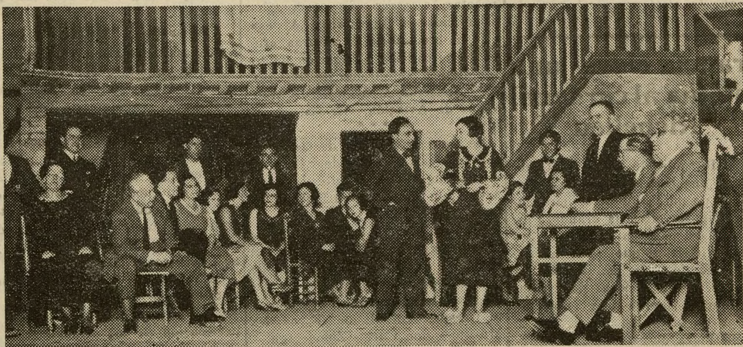
Los autores de «El debut de la Patro» dirigiendo el último ensayo de su obra.

pretenden hacerlo. Así no habría dinero bastante en España para sostenerlo. Creo que debe sostenerse, aunque con decoro, con esplendor; pero sin despilfarros, y creo que debe ser neta y castizamente español. Si creemos en la música española, un teatro oficial debe excluir las obras extranjeras: Rossini, Bizet, Wágner... ¿quién los discute? Pero su lugar no es un teatro lírico Nacional español. El «Barbero», «Carmen» y «Los maestros cantores» se han hecho centenarias, o poco menos, en los carteles del teatro Real, sin que para ello fue-