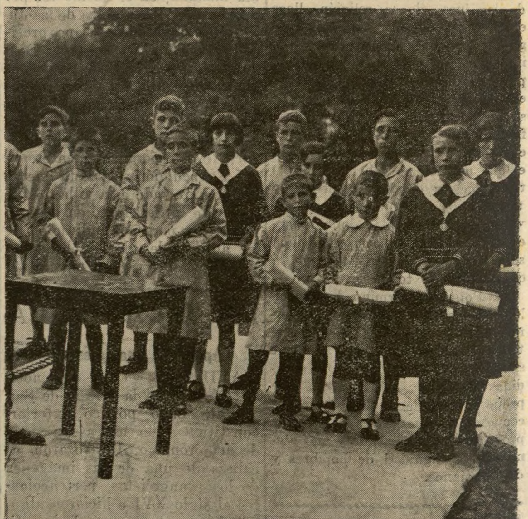
EN EL ASILO DE SANTA CRISTINA

Un grupo de alumnos premiados en el pasado curso escolar.