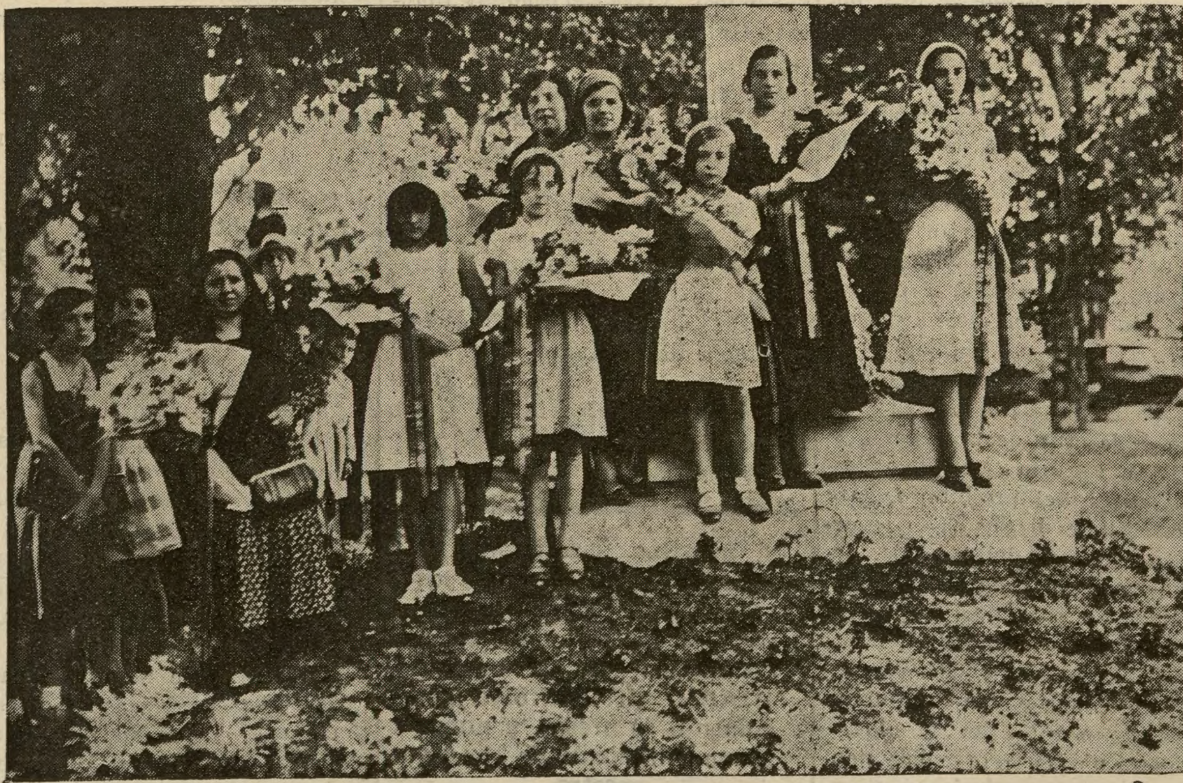
EL COMBATE DEL BARRANCO DEL LOBO

Familiares de los supervivientes, depositando flores está mañana ante los bustos del parque del Oeste, en el XXIII aniversario del combate.