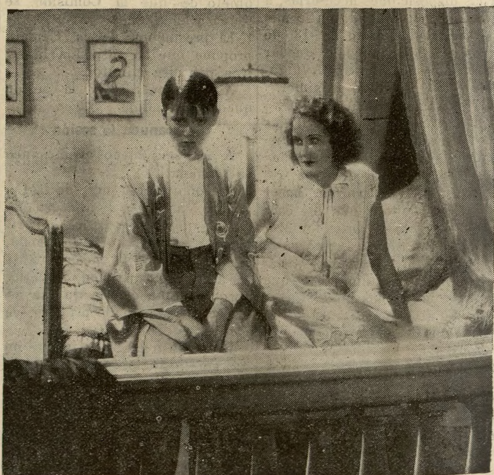
Una escena de la opereta «El teniente del amor», que el lunes se estrena en el cine Barceló