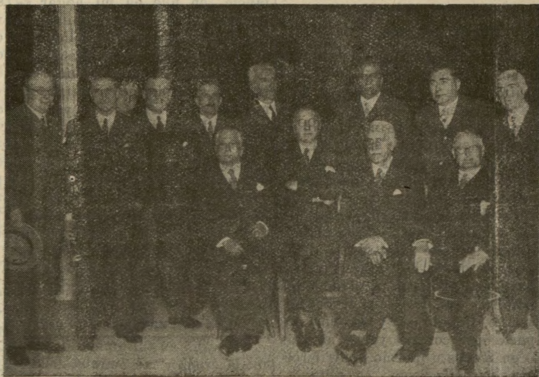
Presidencia del mitin celebrado ayer en el teatro de la Comedia por la Defensa de la Propiedad Urbana.

De esta manera, el pacto obrero puede tener una inmediata y fácil solución, pues con ello se estimularán las nuevas construcciones y acrecentarán las obras de reparación.