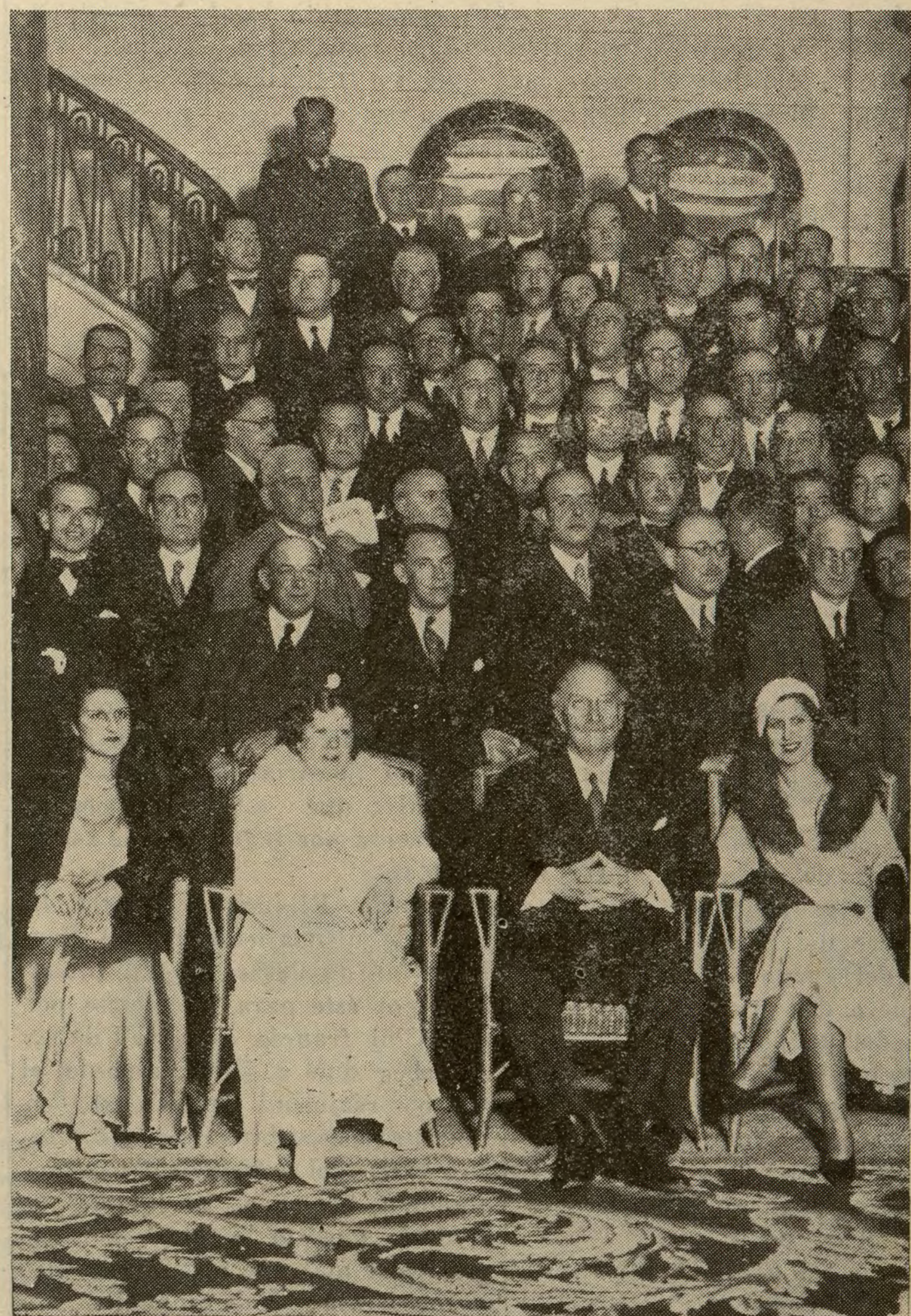
Banquete en honor de D. Alejandro Lerroux, como final de la Asamblea radical, que se ha celebrado recientemente.

Suponemos que cuando del pueblo de Erandio protesten dirán que es de otro sitio la fotografía. De modo que duden ustedes de los pies que se leen en algunos periódicos.