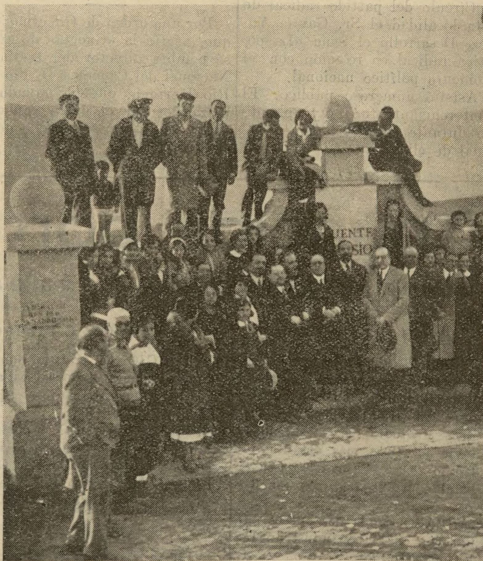
DEL HOMENAJE A D. MANUEL B. COSSIO.

Un aspecto de la Fuente que lleva el nombre del insigne maestro, inaugurada ayer en el Puerto de la Morcuera.