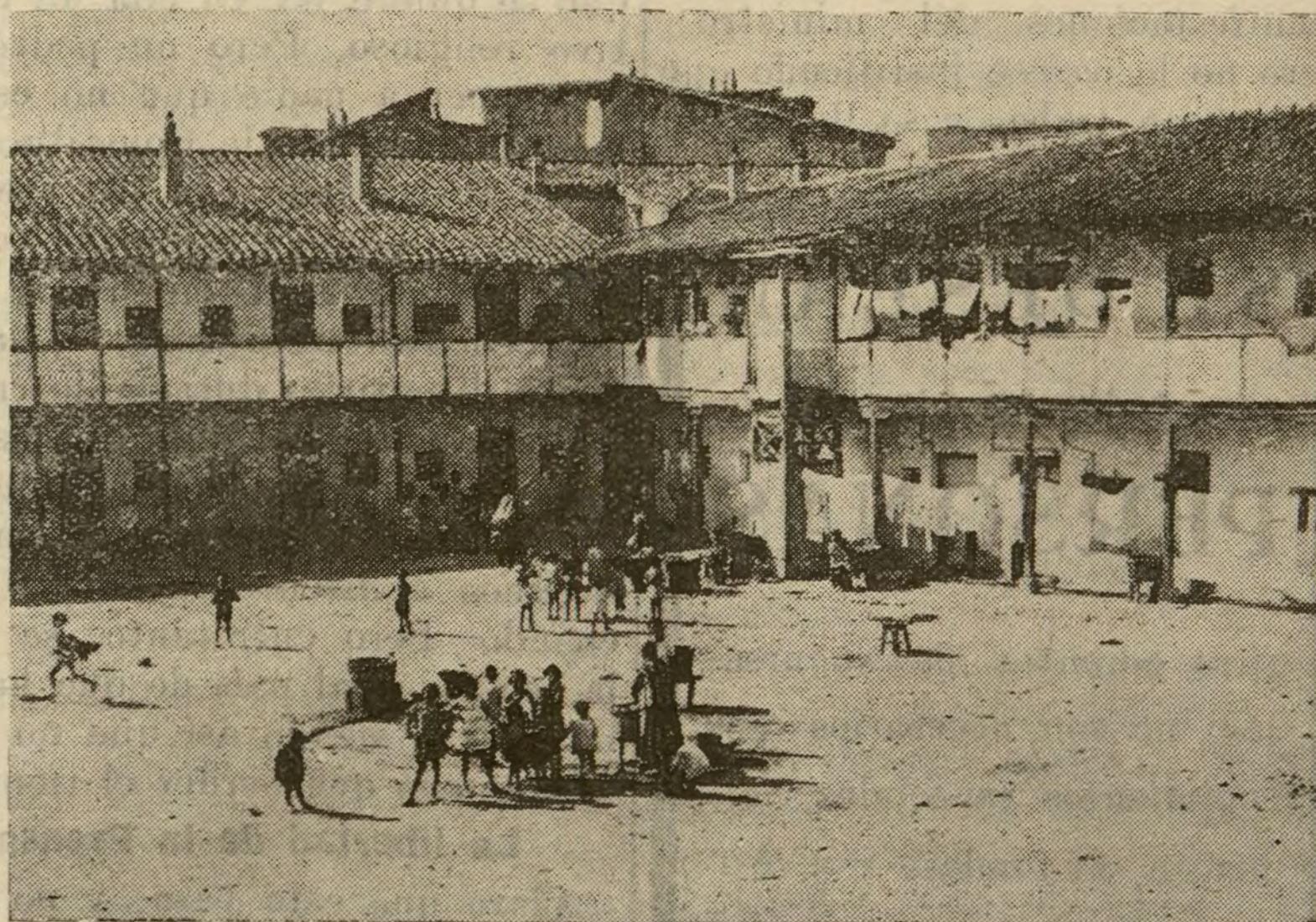
La famosa casa de «Panderon», que tiene 140 cuartos, habitados por 400 personas de la clase obrera, y que va a ser derribada para urbanizar el final de la calle de Méndez Alvaro.