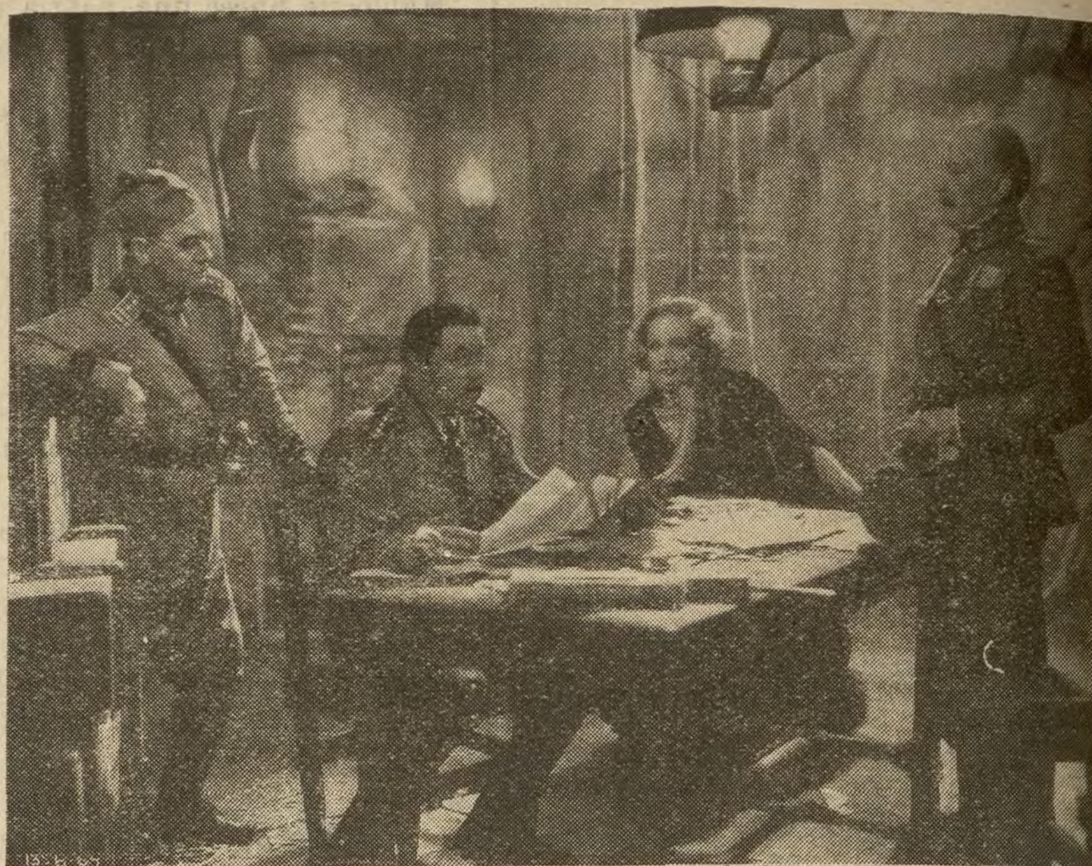
Marlene Dietrich, en el «Expreso de Shanghai», que hoy comienza su segunda triunfal semana.

De los que exhibirá, alternando con los grandes REESTRENOS BARCELÓ