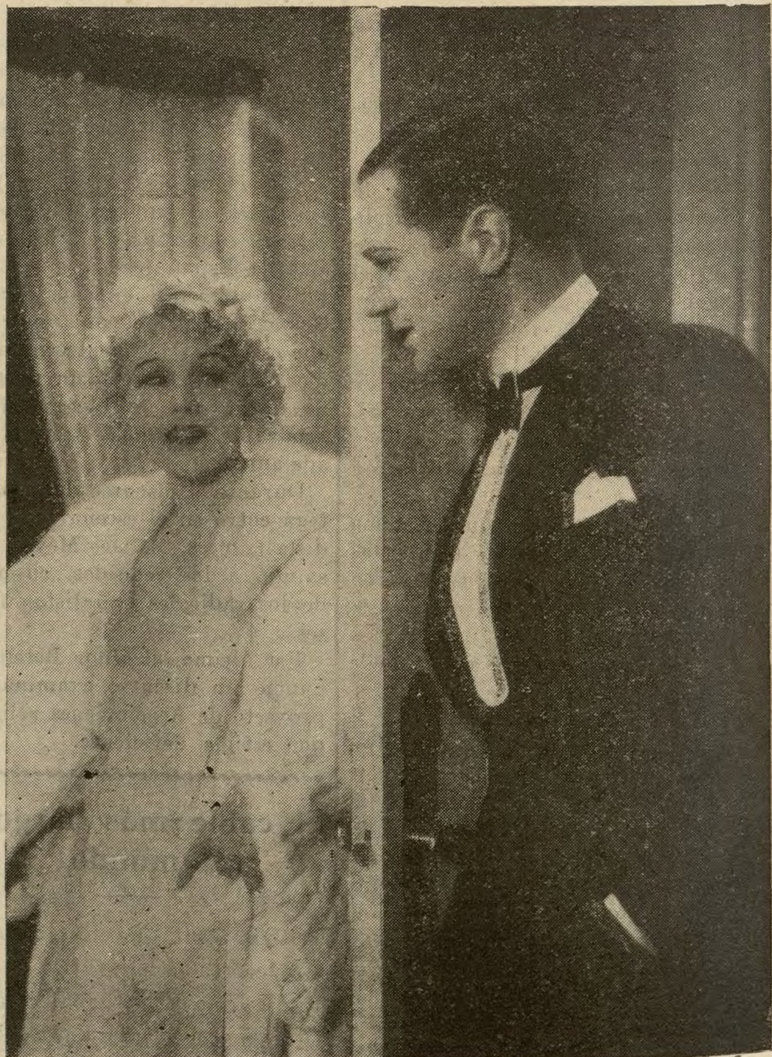
Anny Ondra, en «Kiki», film que presentará esta temporada la casa H. Da Costa.

«Selecciones Filmófono», además de «Karamasoff, el asesino», prepara una serie interminable de films magníficos. Todos los grandes triunfos de París, se proyectarán en España, bajo el sello inconfundible de esta marca tan conocida.