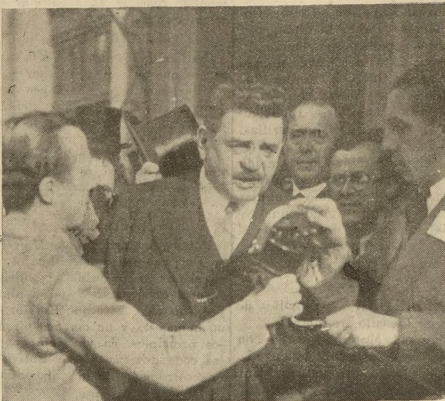
Al llegar M. Herriot a Madrid, en la misma estación, saluda por el micrófono a España.

El Sr. Herriot se sentó a la derecha del presidente de la República y estuvieron hablando cu-