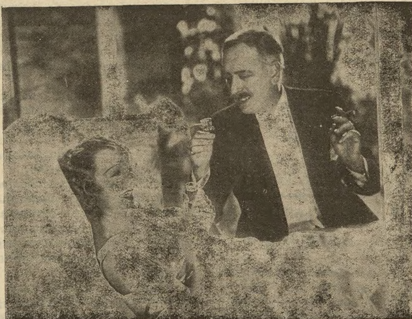
Tercera semana de «Monsieur, Madame y Bibi».

Tenemos mucho gusto en publicar los títulos de las interesantes series de «films» que presentará la Casa H. Acosta: