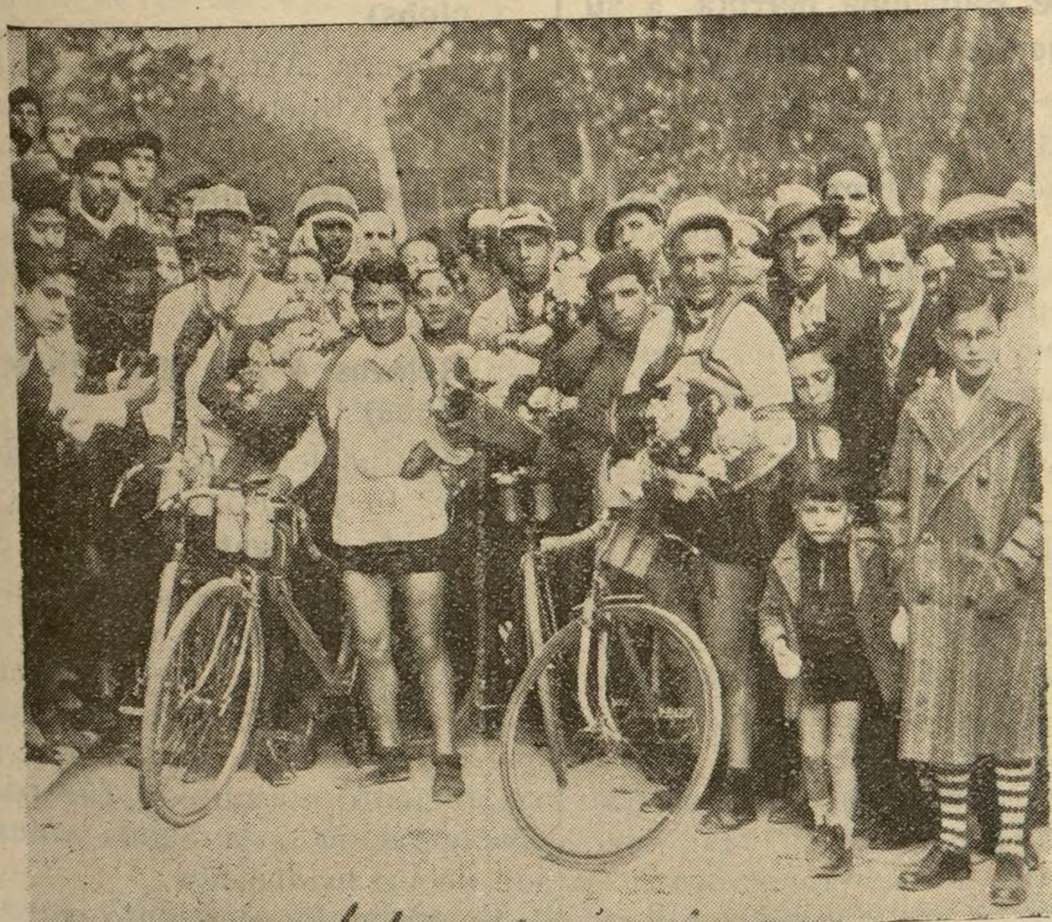
Los ciclistas marroquíes llegaron ayer a Madrid, después de su esforzado viaje desde Algeciras.