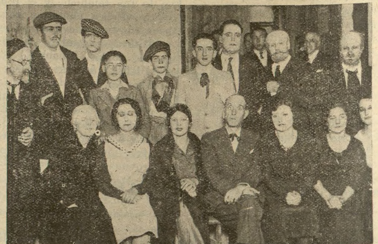
La magnífica Agrupación Artística Ricardo Calvo, que anoche hizo su presentación en el teatro Chueca, con éxito extraordinario.

El gobernador ha sido interrogado sobre este nombramiento y contestó que no tenía noticias de tal designación.