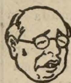
La mañana del Sr. Azaña.— Visitas militares y civiles