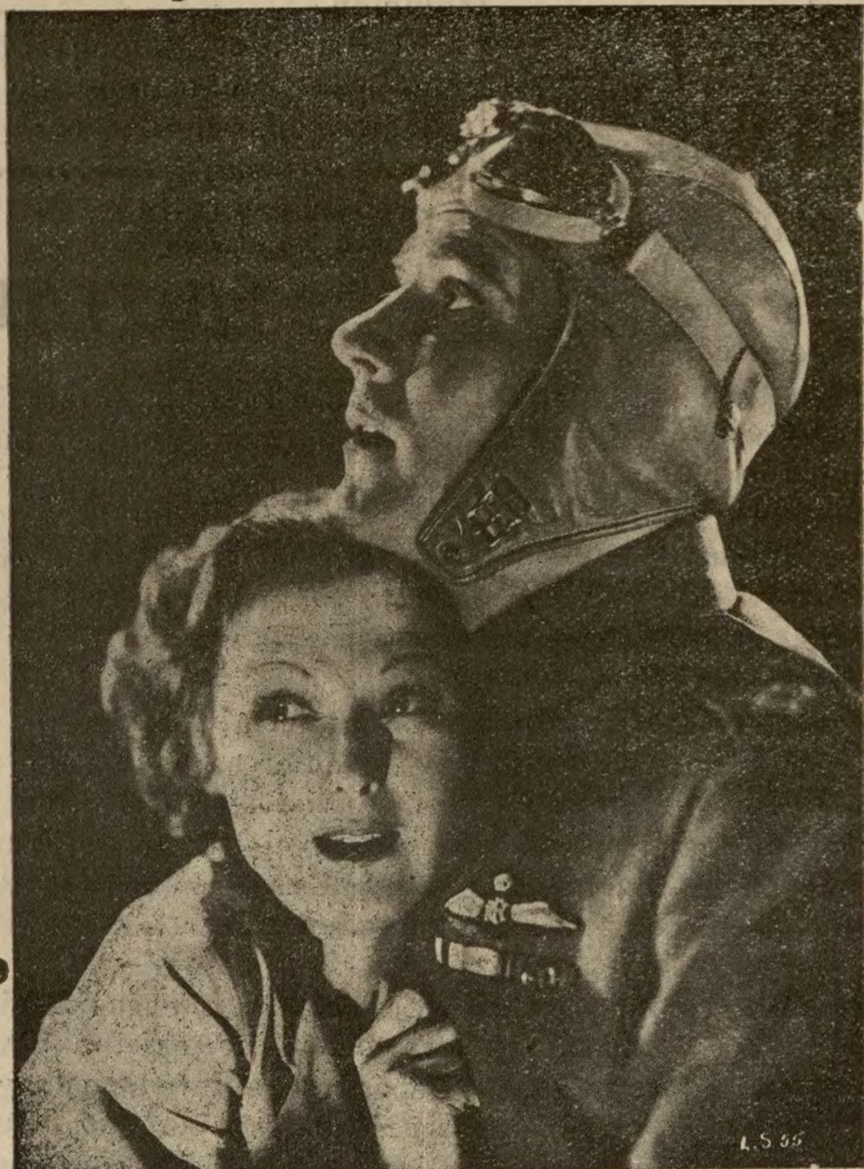
Mary Astor y Joel Mac Crea, magníficos intérpretes del film «La escuadrilla deshecha», producción de la casa S. I. C. E. (R. K. O. Radio.)