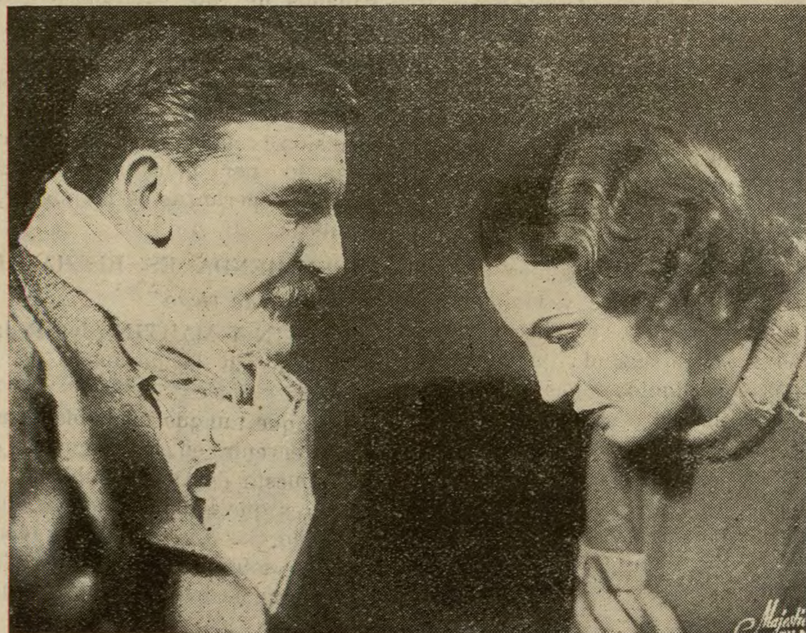
Una escena del film «La condesa de Montecristo», que el lunes se estrena en el Barceló.

Mañana, domingo, a las seis de la tarde, en el domicilio social (Príncipe, 18 y 20) se celebrará un baile familiar organizado por la Juventud de esta entidad, al que quedan invitados todos los socios y familias.