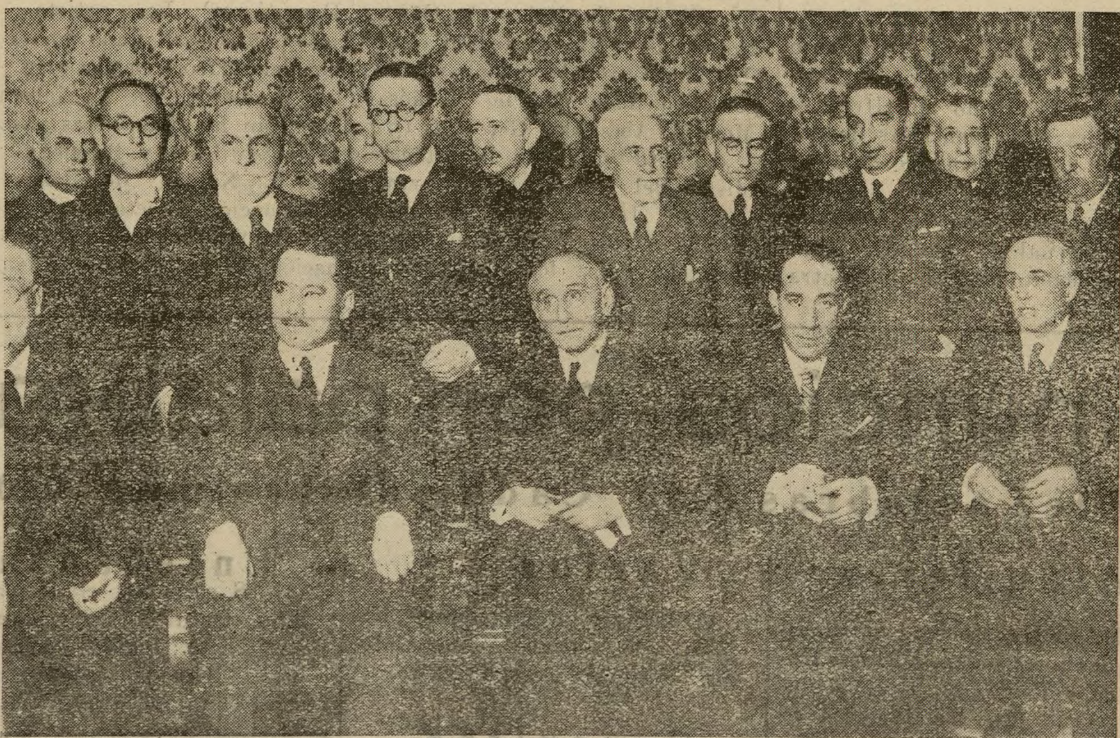
Un grupo de decanos de los Colegios de Abogados de España, durante la Asamblea celebrada esta mañana, en la que se tomaron acuerdos relativos a las últimas disposiciones del señor Albornoz, jubilando a magistrados, jueces y fiscales.

La «Gaceta» publicó ayer una ley del ministerio de Hacienda disponiendo que se emitan sellos de franqueo postal con el retrato de don Manuel Ruiz Zorrilla.