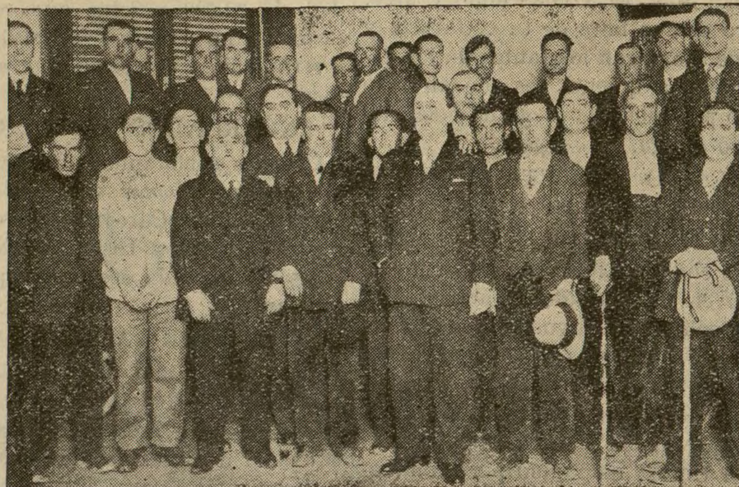
El Sr. Gil Robles, con los obreros campesinos que vinieron de distintos pueblos de España para asistir a los actos organizados por Acción Popular, después de dirigirles la palabra, en el domicilio social, acerca de la transcendencia de la suspensión de los mítines.