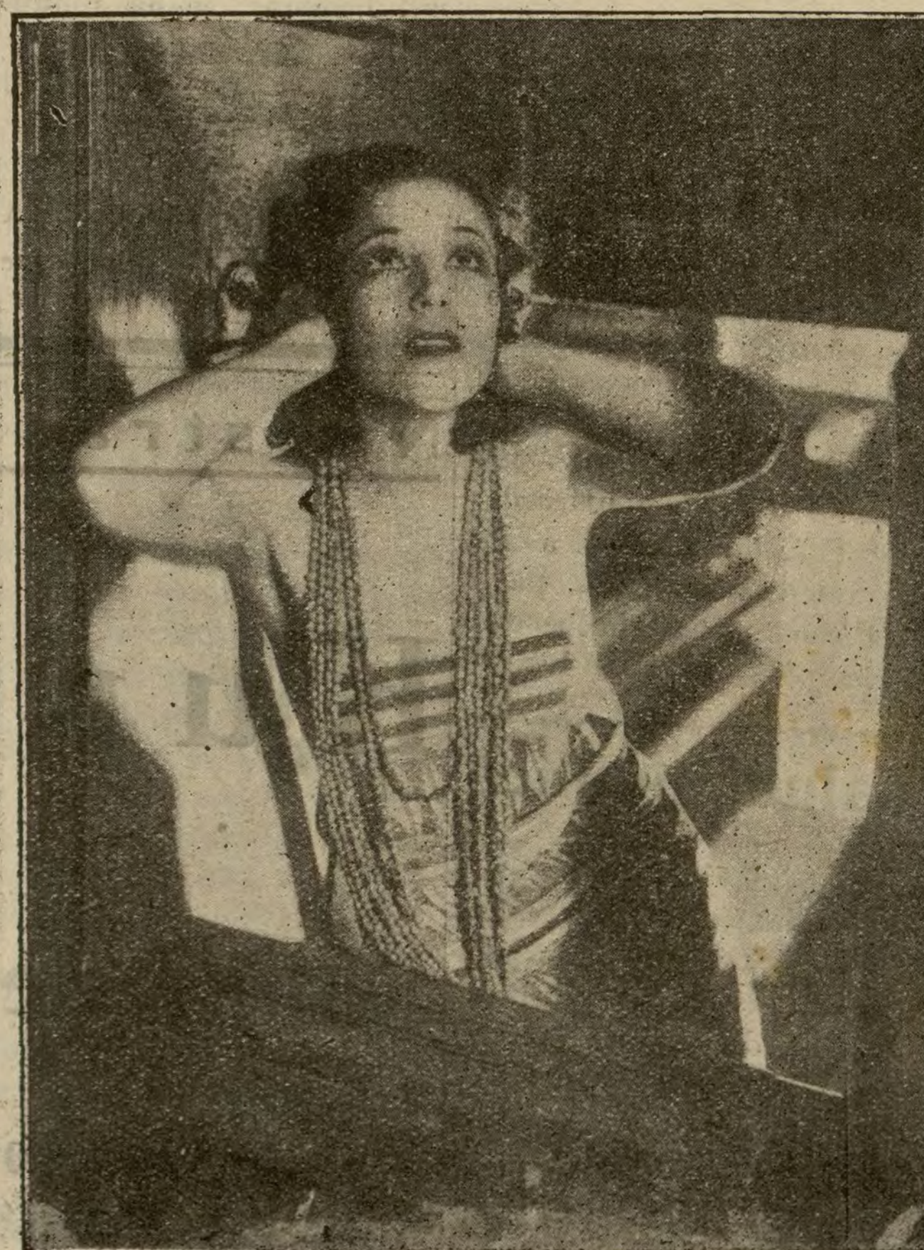
La bellísima artista de la S. I. C. E. (R. K. O. Radio), Dolores del Río, intérprete magnífica de «El Ave del Paraíso»