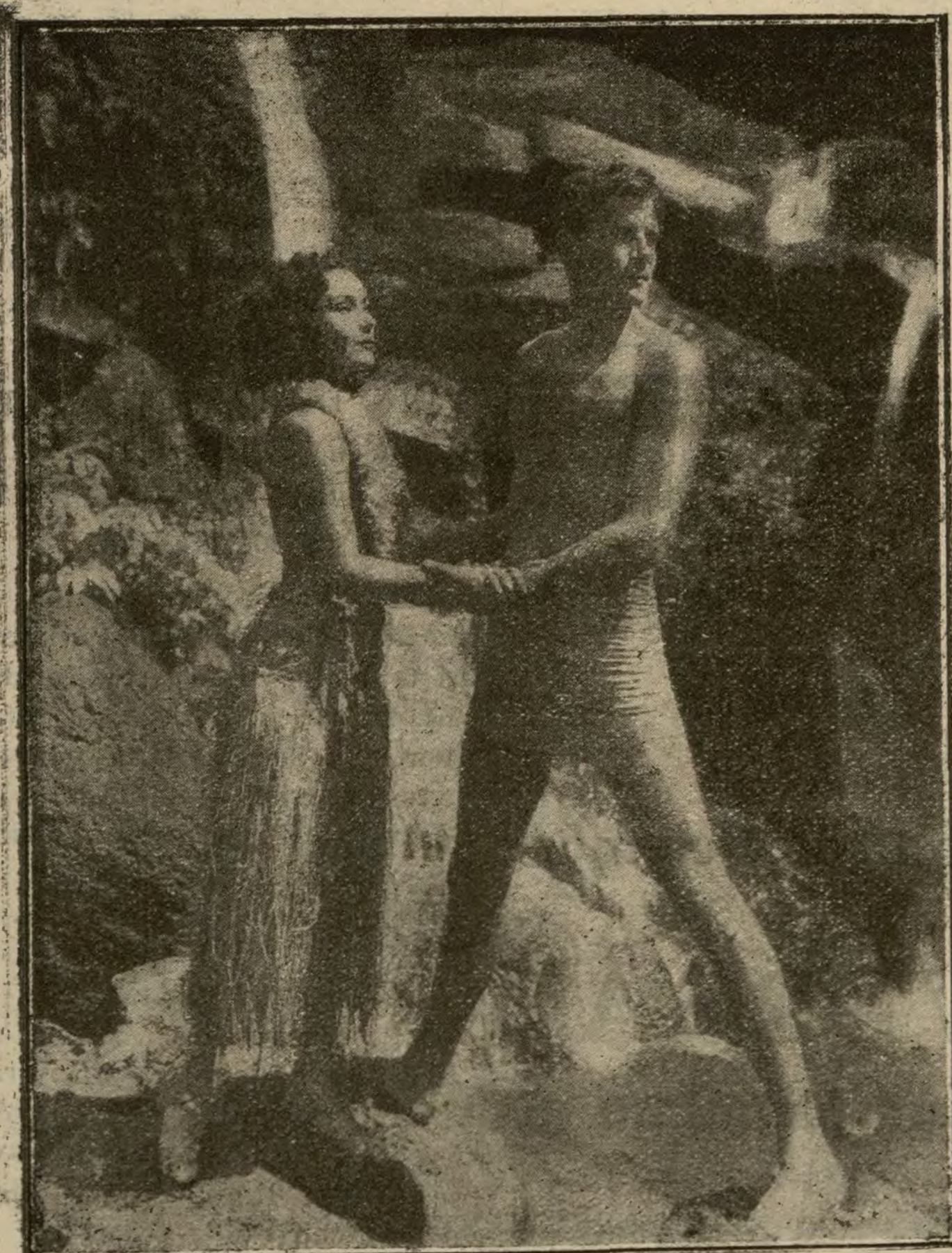
Dolores del Río y Joel Mac Crea en una escena del maravilloso film «El Ave del Paraíso», que presentará en breve S. I. C. E. (R. K. O. Radio).