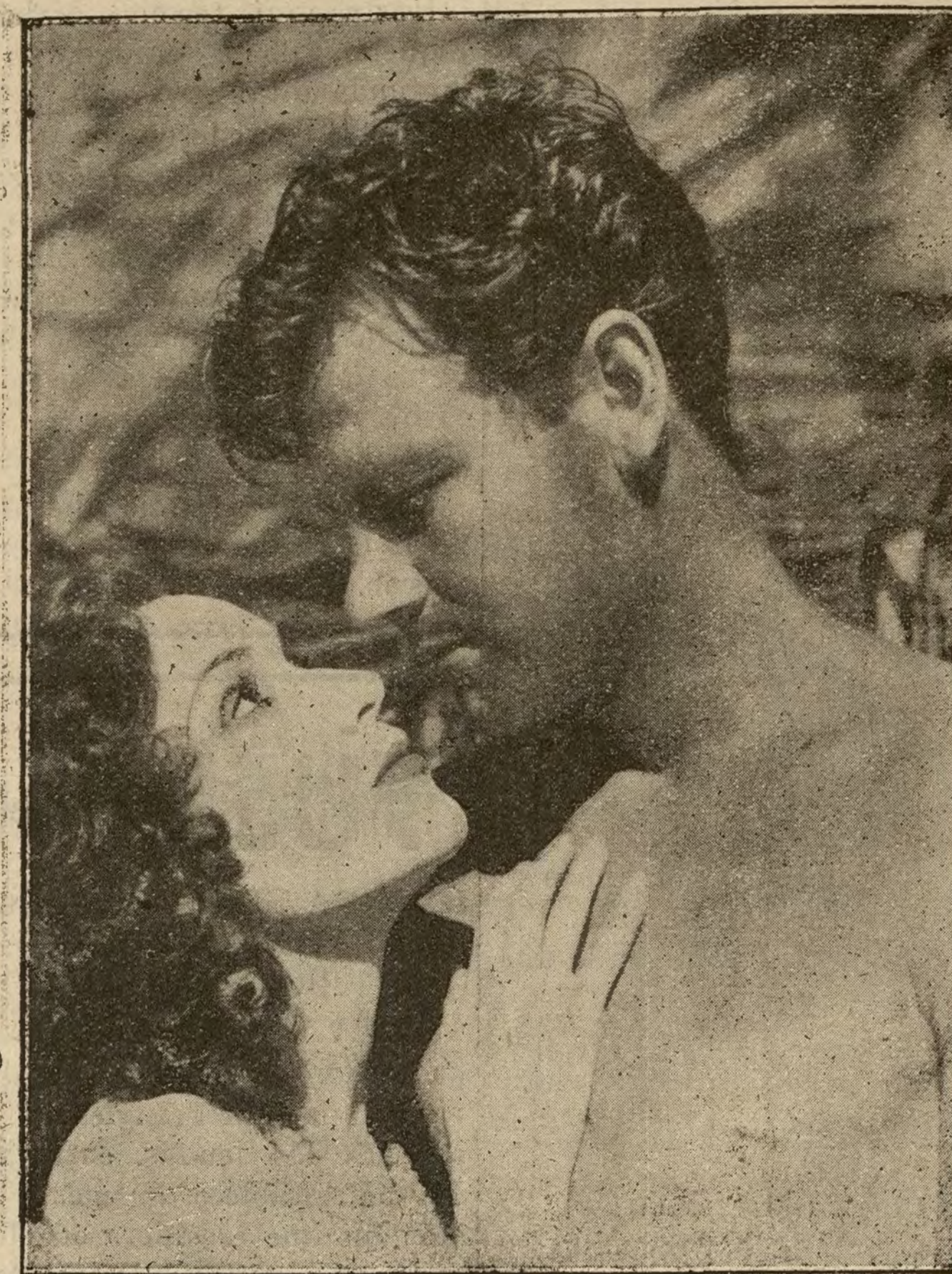
Otra escena de Dolores del Río y Joel Mac Crea, en «El Ave del Paraíso», la maravillosa superproducción con la que esta temporada se presentará la S. I. C. E. (R. K. O. Radio).

—¿Es cierto que le gusta a usted recibir cartas de mujeres?