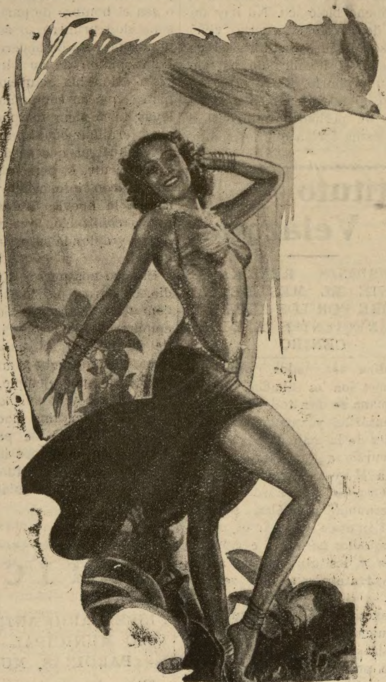
Dolores del Río en «El Ave del Paraíso».

Es verdaderamente interesante, querido lector, esta noticia que estás leyendo. Dolores del Río y Joel Mac Crea, ambos protagonistas del maravilloso film «Sice» (R. K. O. Radio) se aman locamente. La verdad es tan grande que a todos los públicos del mundo los ha llenado de sorpresa. Juntos, muy juntos, jurándose eterno