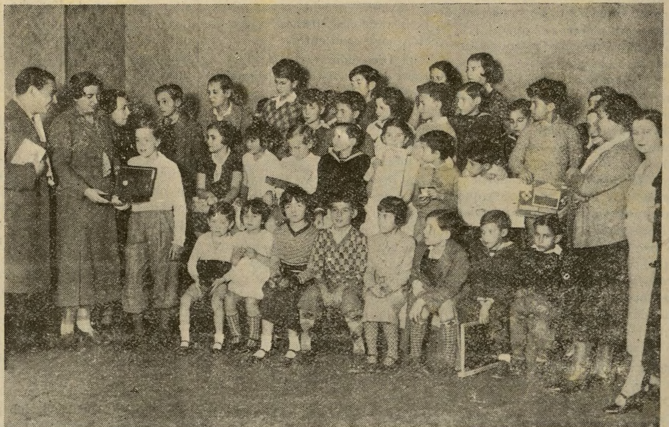
Los niños premiados en el Concurso de dibujos celebrado por «Liceum Club».