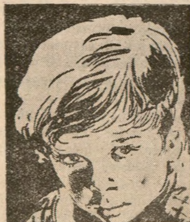
Jackie Cooper, maravilloso intérprete de «Champ»

Vea usted «Ave del Paraíso», en las Islas Hawai, por cuyas llanuras corre trágicamente amenazador la