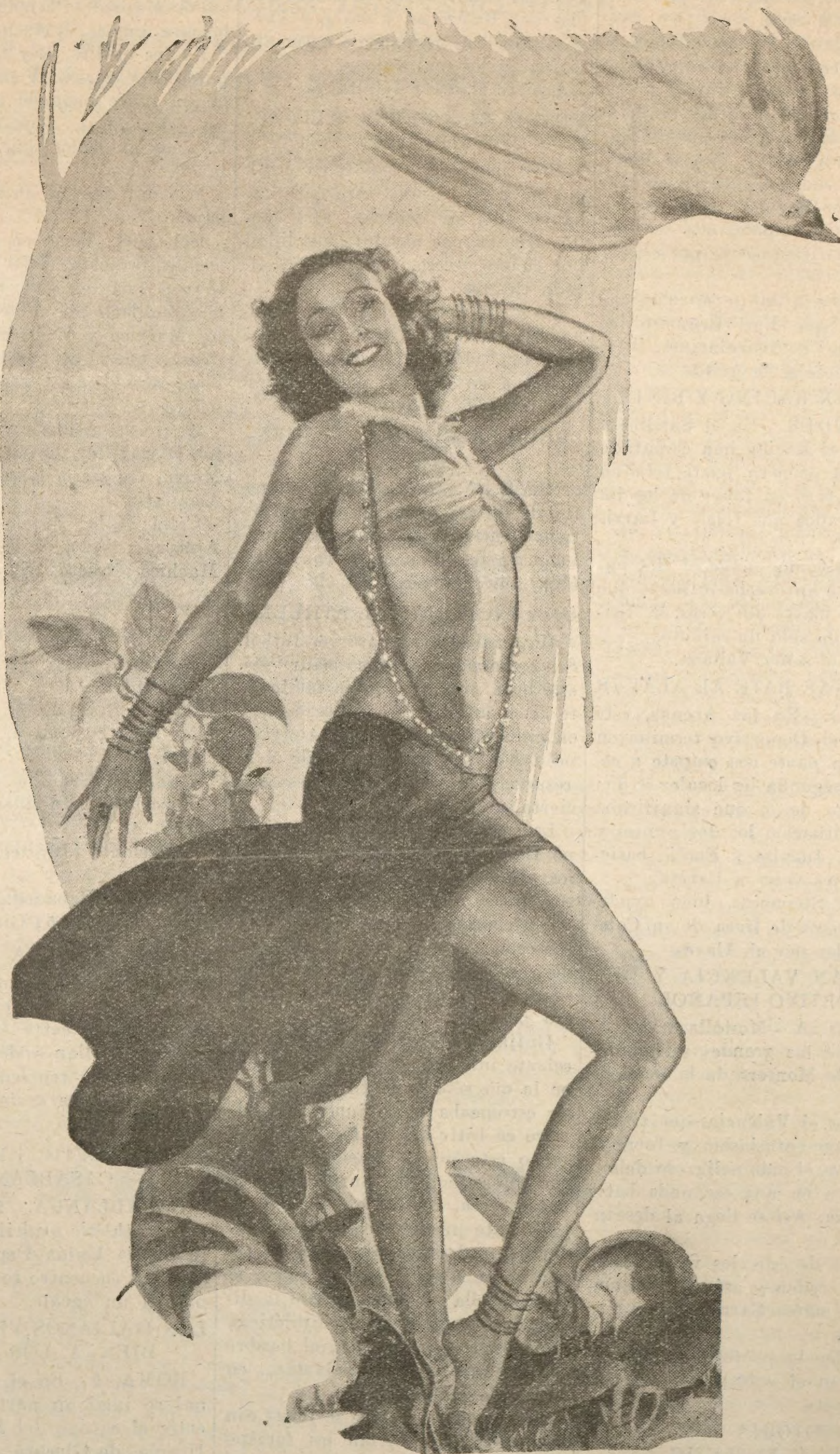
Dolores del Río, que ha vuelto a nosotros convertida en una maravillosa «Ave del Paraíso», el gran triunfo de la S. I. C. E. (R. K. O.-Radio).

En breve continuaremos publicando las memorias de Dolores del Río, Páginas del libro de mi vida