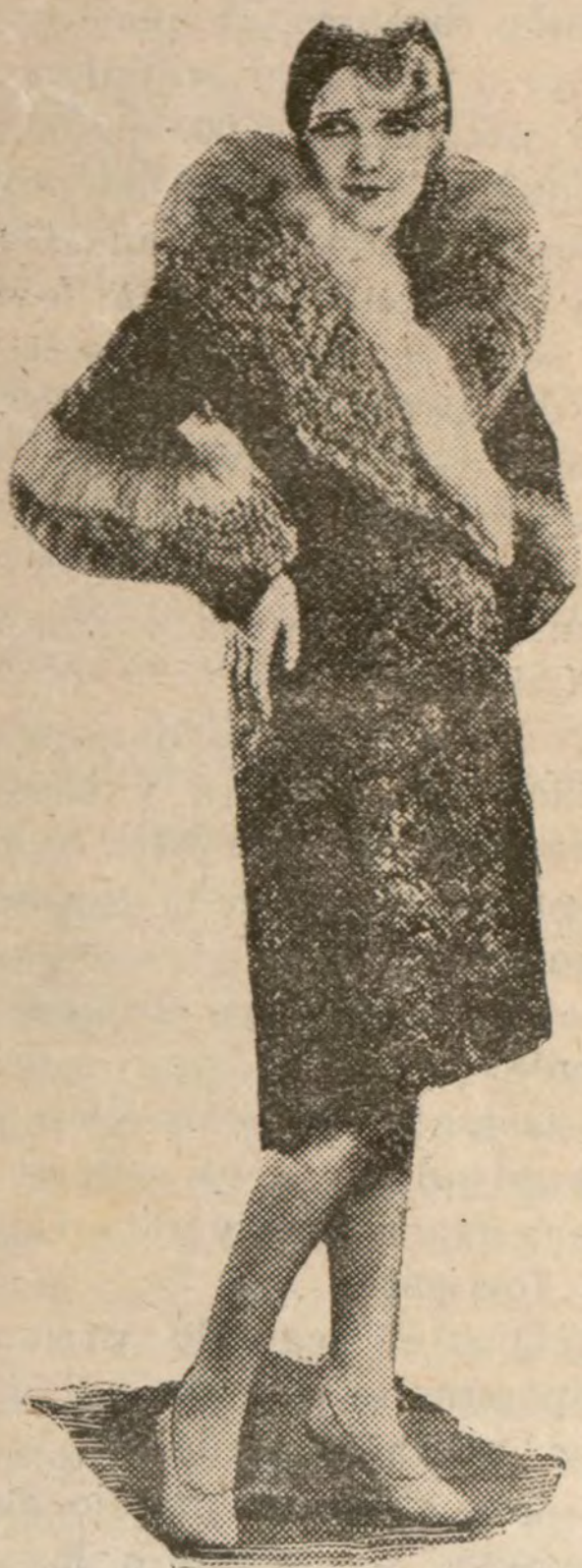
Anita Page, la deliciosa rubia que, sin ser la presente para ella una temporada triunfal, ha sabido mantener su rango artístico.

Publicamos en la presente página unas cuantas fotografías de otras tantas «estrellas» que triunfaron en el lienzo de plata, durante el año cinematográfico. Pero estaría incompleta la lista y seríamos injustos si a esa lista fotográfica, no agregásemos los nombres de Greta Garbo, Marlene Dietrich, Dolly Haas, Marie Glory y Florence, Lilyan Harvey, Joan Crawford, triunfadoras en «Mata-Hari», «El expreso de Shanghai», «El teniente del amor», «Madame, monsieur y Bibi», «El Congreso se divierte» y «Danzad, locos, donzados», respectivamente.