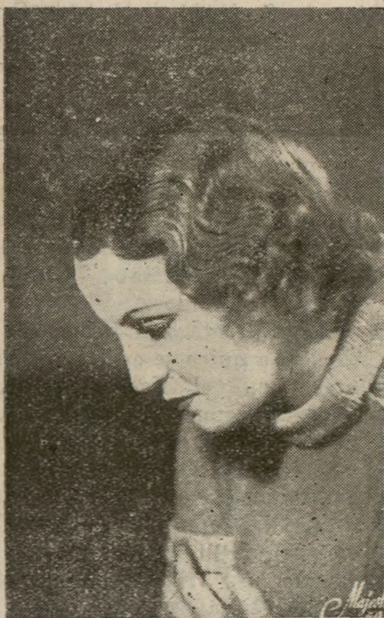
Brigitte Helm, la bellísima «estrella» alemana que hizo gala de su arte personalísimo en «La Condesa de Montecristo».

En el año que acaba de desaparecer tras los umbrales de la historia del mundo, se proyectaron en las pantallas madrileñas 340 películas.