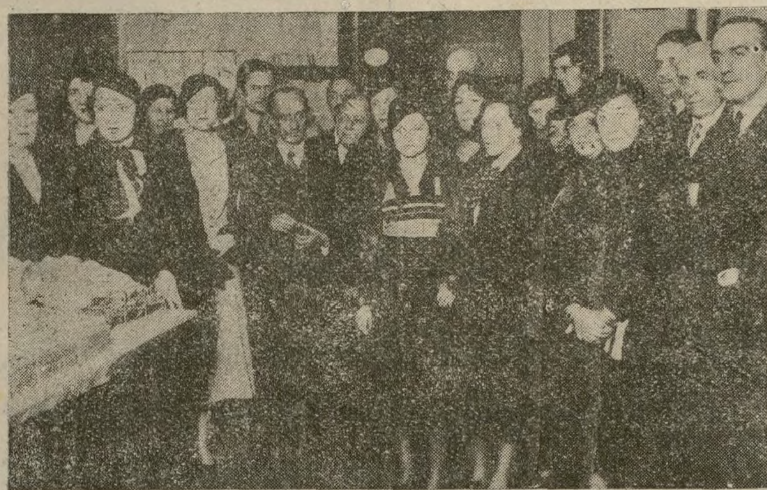
LA SIMPATICA FIESTA DE REYES

El director de «La Nación», con las bellas señoritas que efectuaron el reparto de juguetes entre los niños de redactores, empleados y operarios del querido colega, acto que se celebró ayer tarde.