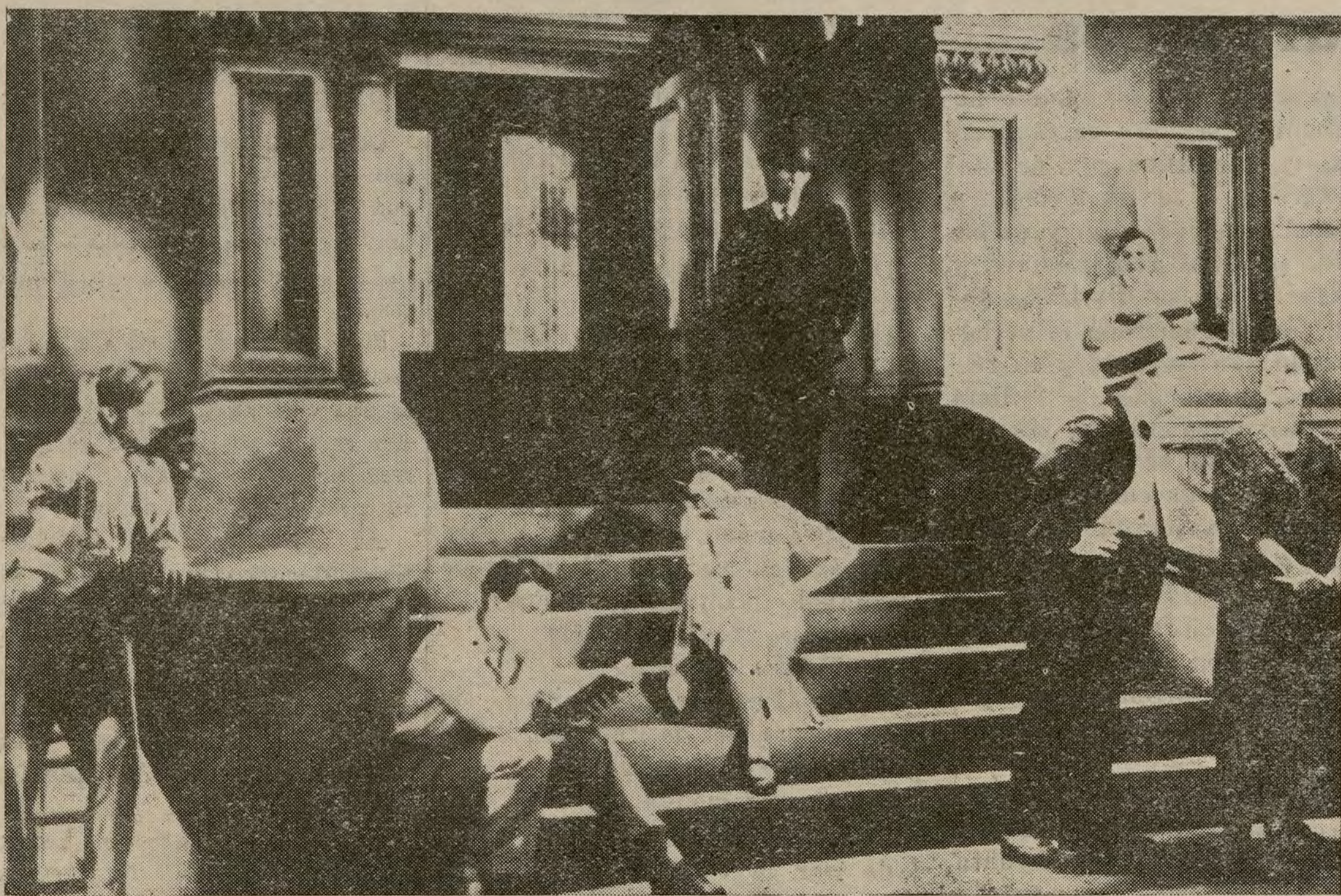
Una escena del film «La Calle», que el lunes próximo presenta Artistas Asociados.

un local difícilmente superable. Sus modernísimas instalaciones eléctricas y de refrigeración; el servicio de radiación de noticias de interés general, así como el de custodia de automóviles; el servicio gratuito de paraguas; su nuevo decorado y su novísimo equipo pro-