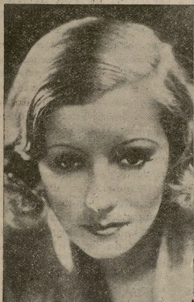
Greta Garbo, la ilustre «estrella» sueca, de quien se dice en estos días, que con fecha próxima, visitará Madrid.

Las mejores llevadas a cabo por la Empresa S. A. G. E. en su Palacio de la Música, hacen de éste