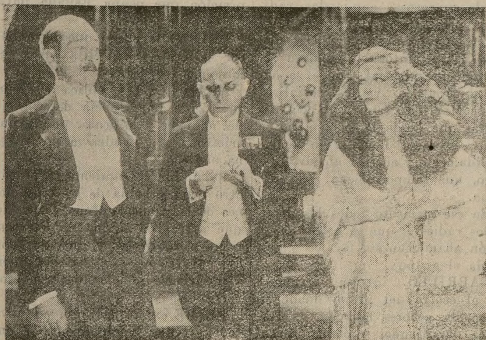
Lily Damita y Adolfo Menjou en una escena de «Amigos o rivales», film R. K. O., distribuido por SICE, que el lunes se estrena en el Avenida.