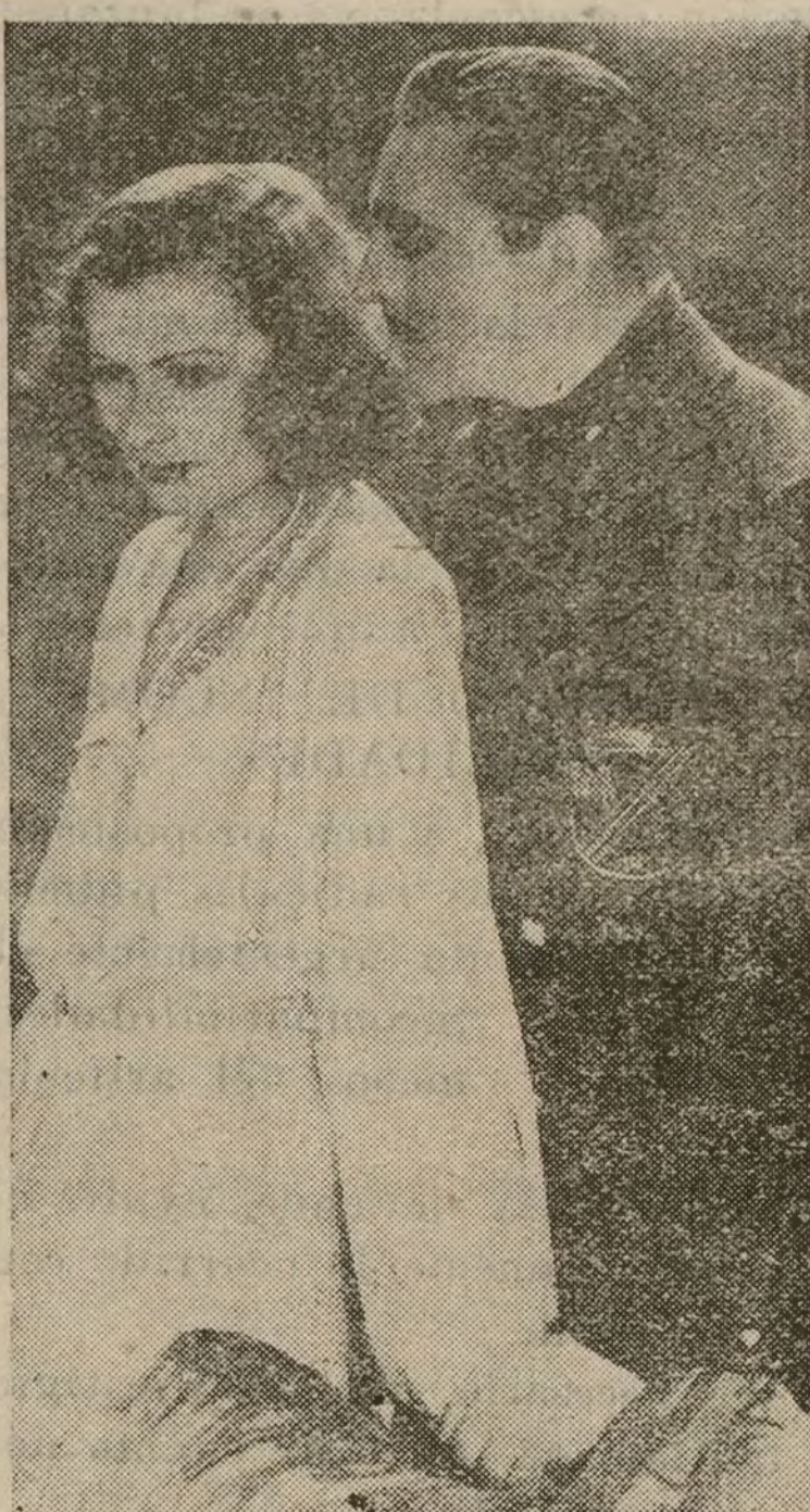
Greta Garbo y John Barrymore en una escena de «Grand Hotel»

LEA USTED TODAS LAS SEMANAS NUESTRA PAGINA :: CINEMATOGRAFICA ::