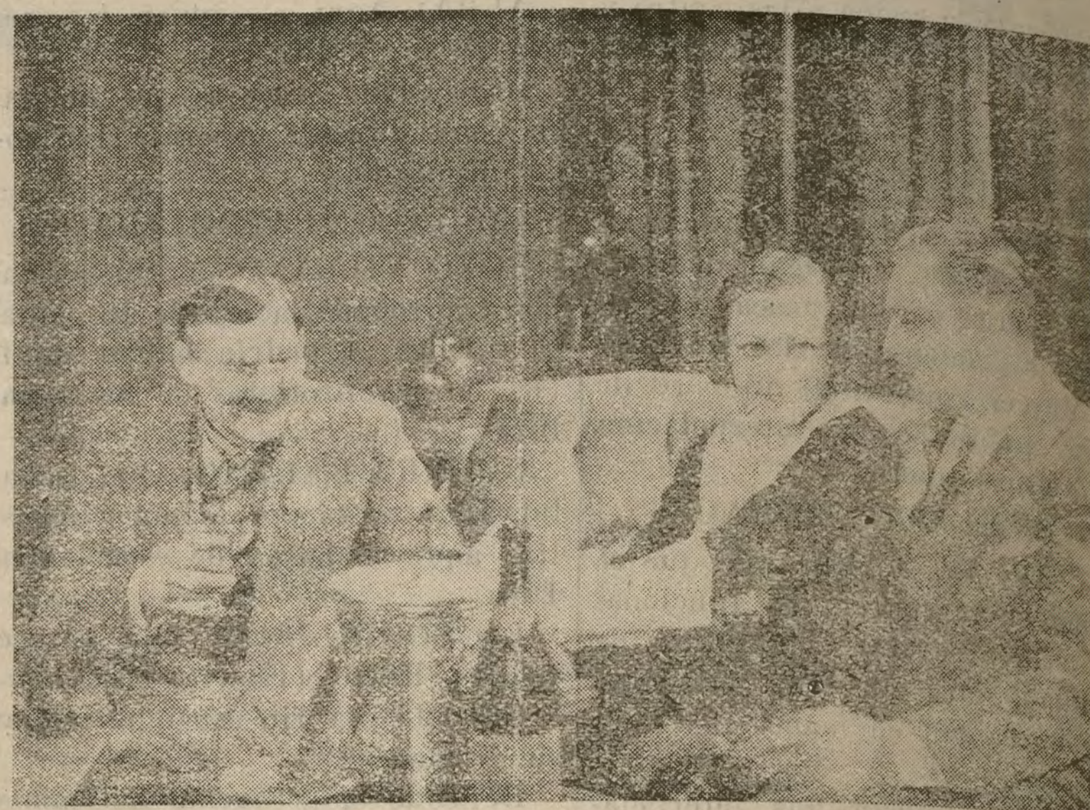
Una interesante escena de «Grand Hotel», film que hoy se estrena en el Palacio de la Música.