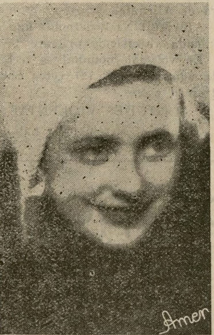
FIGURAS DE «SOL EN LA NIEVE»

¿Dónde la veremos? Acudid al cine Figaro y lo sabréis.