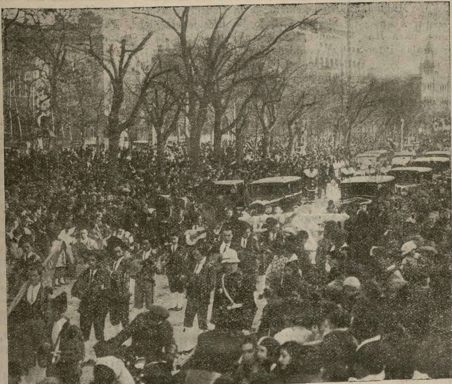
EL CARNAVAL EN MADRID

Un aspecto del paseo de la Castellana durante el desfile de carrozas, estudiantinas y máscaras.