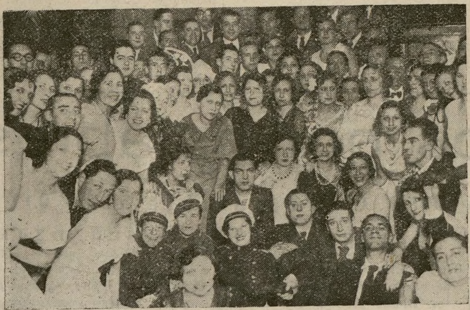
LOS BAILES DE CARNAVAL

Organizado por esta entidad, el próximo viernes, día 3 de marzo, a las diez y media de la noche, se celebrará en el Salón Trouville (calle de Fuencarral, 124), un baile de disfraces.