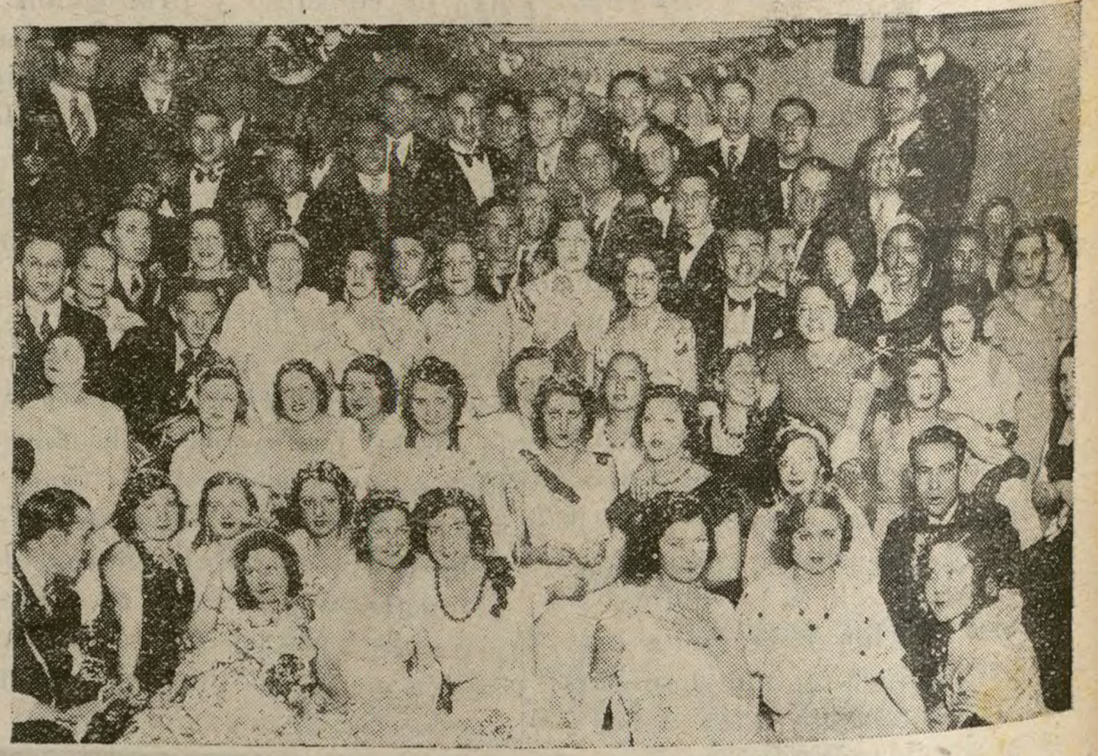
LOS BAILES DE CARNAVAL

Ante la suposición inexacta de que hemos tratado de hacer en esta cuestión una maniobra política, nombrando presidente honorario a don Alejandro Lerroux, baste decir que el señor Lerroux fué nombrado presidente honorario de la Sociedad Central de Aparejadores (no existía entonces la Federación) el año 1917, por haber defendido la creación del Cuerpo de Aparejadores del Catastro. Y en la ocasión presente el señor Lerroux no ha tenido la menor intervención en nuestro asunto que, repetimos, ha seguido paso a paso y a la luz del día su tramitación reglamentaria en la Cámara.