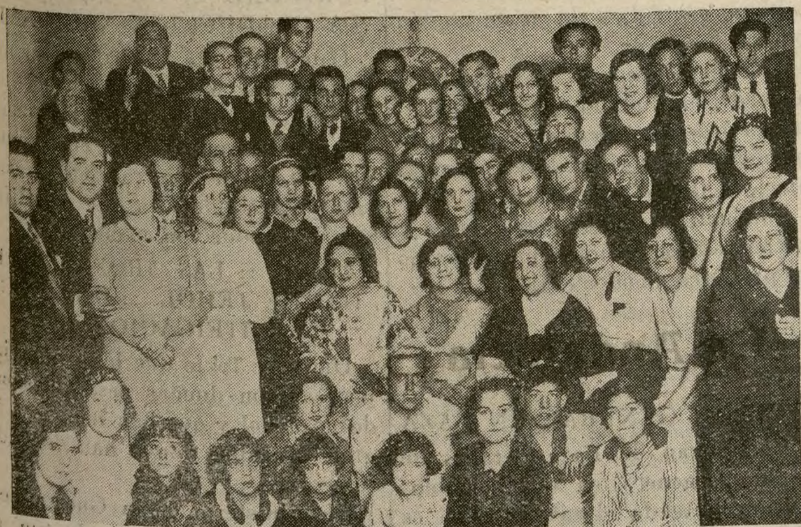
LA DESPEDIDA AL CARNAVAL

Se mantiene, entre tanto, la co- laboración y participación en la Sociedad de las Naciones como or- ganismo encaminado al manteni- miento de la paz y se tiende a es- trechar las relaciones políticas con la América española.