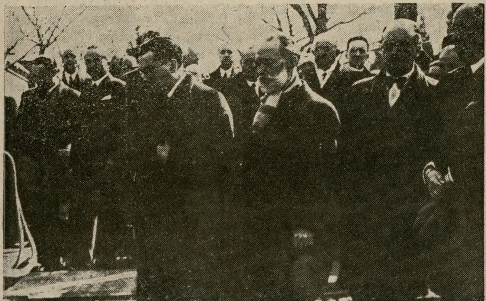
El hijo de nuestro director rezando en el cementerio ante el cadáver de su ilustre padre.