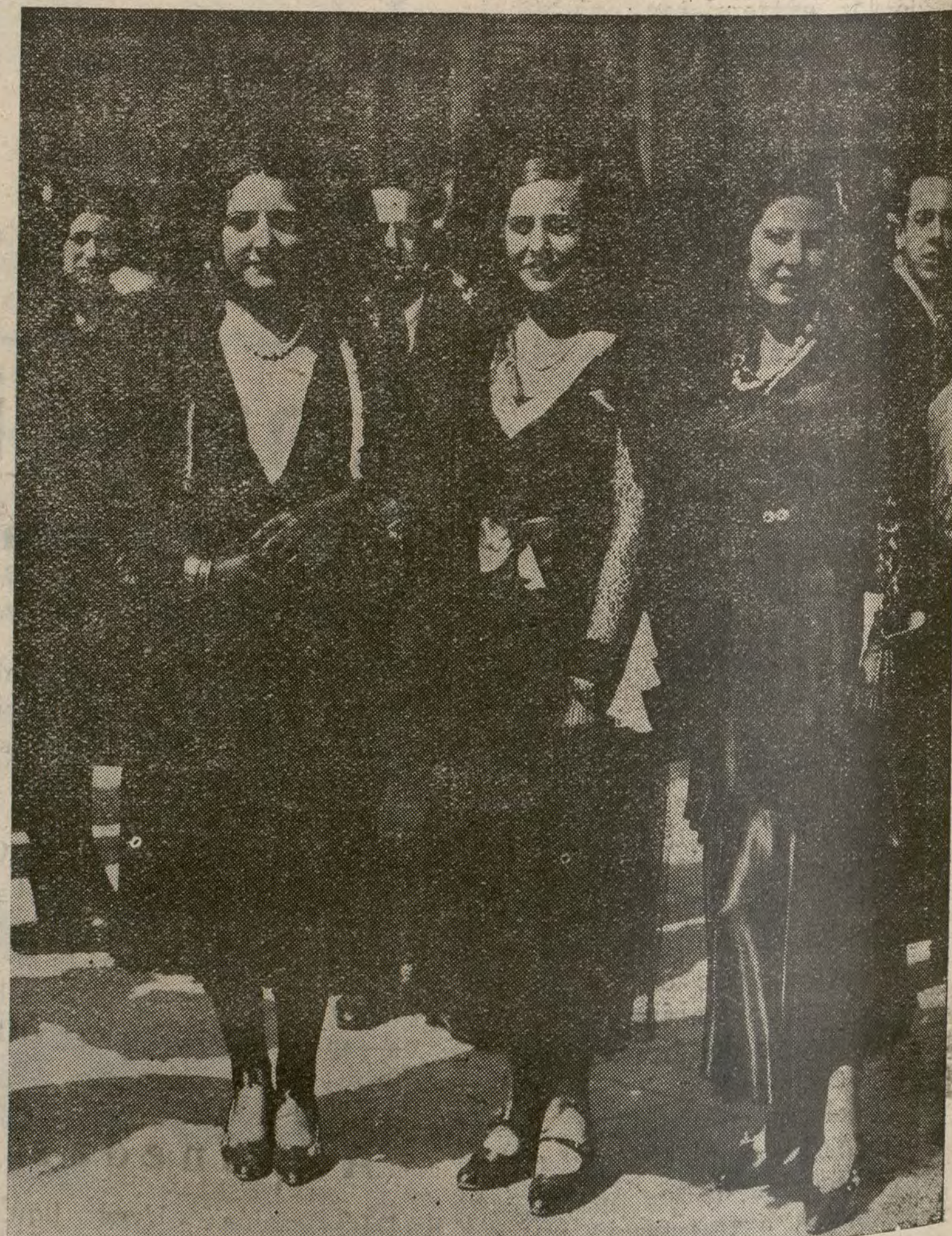
COMO EN PLENA MONARQUIA.— Visitando los S rs granicos.

«Comprometido a reunir a los alcaldes afectados por el problema naranjero, me considero obligado a convocarlos para mañana (por hoy), jueves. Es indecible el ansia de noticias. Les reitero telegráficamente la suplica del cumplimiento de su promesa verbal y un pensamiento concreto del Gobierno susceptible de resolver el conflicto desastroso que amenaza vitalmente a la producción.»